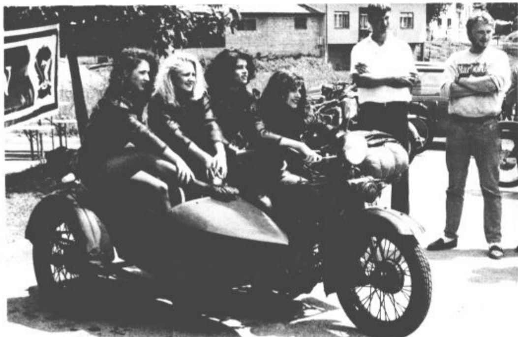
Le kdo bi se mu (jlm) uprl?