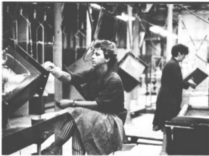
Popoldanska izmena je 14. julija zadnjič delala ob stari peči

Med večja naložbena dela v Gorenju Gospodinjski aparati sodi zamenjava peči za temeljni emajl in sušilnika temeljnega emajla v programu Kuhalni aparati. Po 22. letih nepretrganega delovanja so delavci Vzdrževanja, tudi s pomočjo zunanjih podjetij (ESO, Vegrad) staro peč že porušili in v manj kot mesecu dni, bo zažarela nova. Za razliko od stare, bodo novo kurili z zemeljskim plinom, vendar tudi z možnostjo alternativnega goriva (lahko olje).