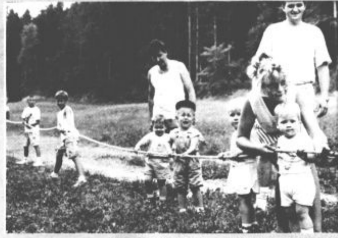
"Ne bom vlekel, na oni strani je eden več"

zbrali. Prav je tako. Točno 90 bi jih moralo biti, dopusti, obveznosti in še kaj, pa so bili razlog za udeležbo "le" 53-ih. Medvedova mama ima danes 83 let, ata je žal že umrl, v skoraj 55-letnem zakonu se jima je rodilo 13 otrok, temu lahko prištejemo še 31 vnukov, 16 pravnukov, pa kaj bi s številkami, življenje jih spreminja nenehno in vztrajno; pomembno je, da se imajo radi, da so se imeli lepo.