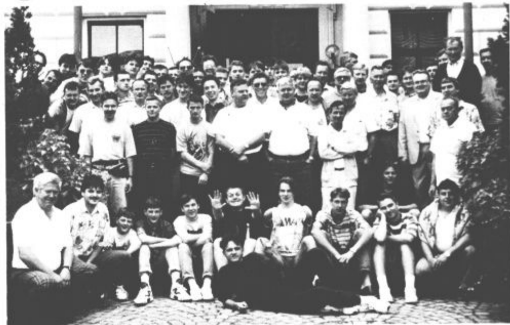
Glavna vaja je za nami, pred nami je finale...

Nastop na kakršnem koli svetovnem prvenstvu ni mačji kašelj. Priznanje nastopajočim je že to, da so med nastopajočimi, v družbi najboljših. Če pa tak nastop okraši še zlata medalja in to že četrta zapored, potem ni noben trud in nobena pot zaman.