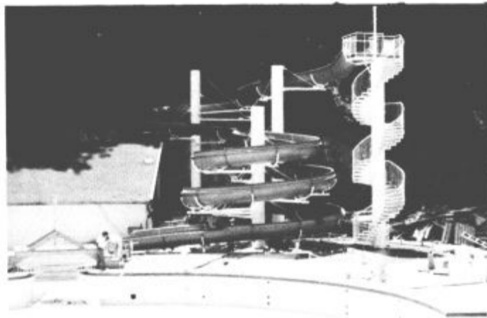
Tobogan - velikan v Moravskih toplicah sodi med prvih 10 v Evropi. Tako po velikosti kot dolžini in številu zavojev.

jetje Veplasa iz Velenja. Tobogan je dolg kar 107 metrov, vgrajenega je preko 13 ton jekla in skoraj 4 tone okrepljenega poliestra. Nosijo ga