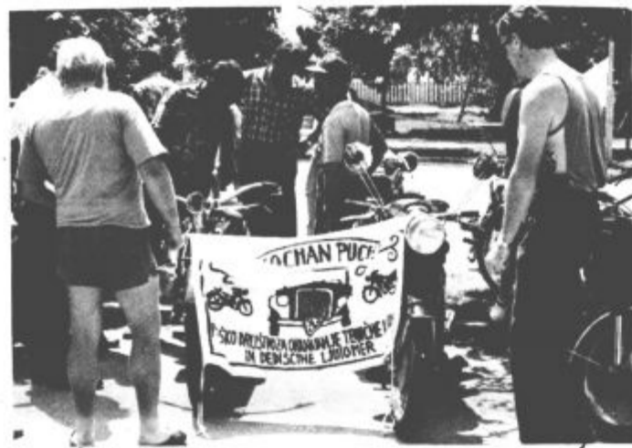
Res, pogled za sladokusce, ki ga slika ne pričara v celoti