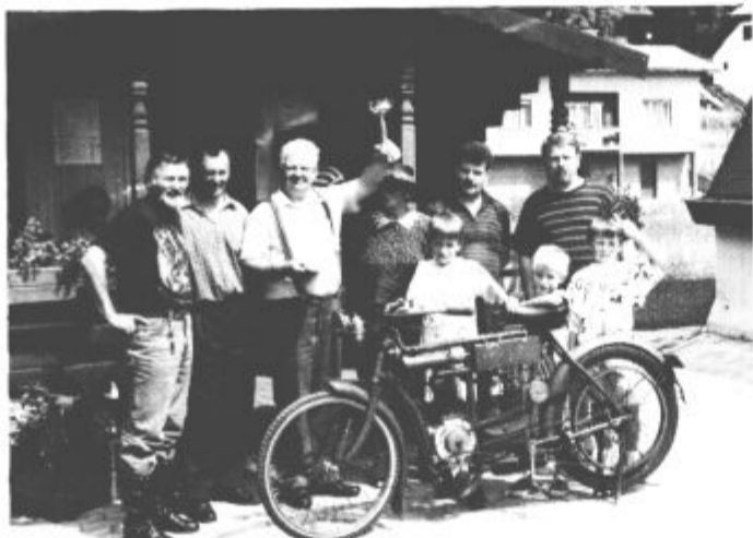
Izzivalec iz leta 1905 z lastnikom, voznikom in gostitelji

In starčki s sedmim, osmim, celo devetim križem na kolesih niso razočarali, prava paša za oči in srce ljubiteljev motorjev so bili. Zbrali so se v soboto popoldne pred gradom Vrbovec v Nazarjah, za tem krenili do kampa v Logarski dolini, v njem nedeljsko dopoldne preživeli v prijetnem vzdušju in spretnosti vožnji, popoldne pa so se spet zbrali ob nazarski graščini. Ob tem je odveč povedati, da so čisto pravi test spretnosti in vzdržljivosti prestali med vožnjo do Logarske in nazaj. Tisti, ki so to res opravili, so gotovo več kot kaveljci, korenine