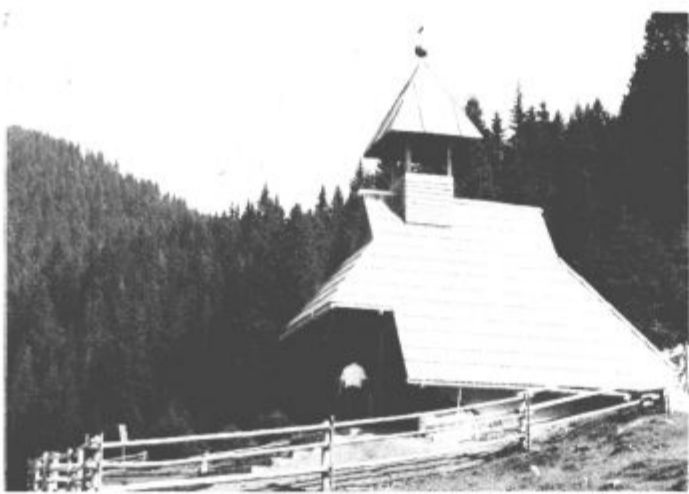
Kapelica bo gotovo obogatila podobo Morave