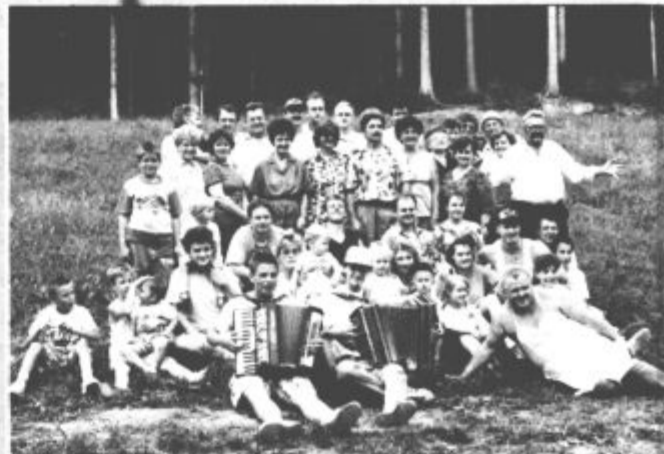
"Ton" dobremu razpoloženju sta dajala odlična harmonikarja

Gotovo so redke družine, ki se vsake toliko časa malo "sprehodijo" po rodbinskem deblu, njegovih vejah in vejicah, še bolj redki pa so primeri, da se iz takega sprehoda rodi prijetno in veselo, že kar množično srečanje. Želite primer? Medvedovim, ki "pokrivajo lepo področje sosednjih občin in še katere povrhu, je to uspelo. Na minuli sobotni dan so se zbrali v in ob mozirskem strelišču in glede na počutje in razpoloženje se bodo še