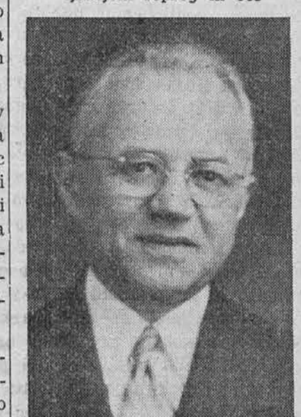
kateri je zatisnil svoje mile oči za vedno dne 12. okt. 1947.

ob tretji obletnici kar je umrl naš ljubljenski soprog in oče