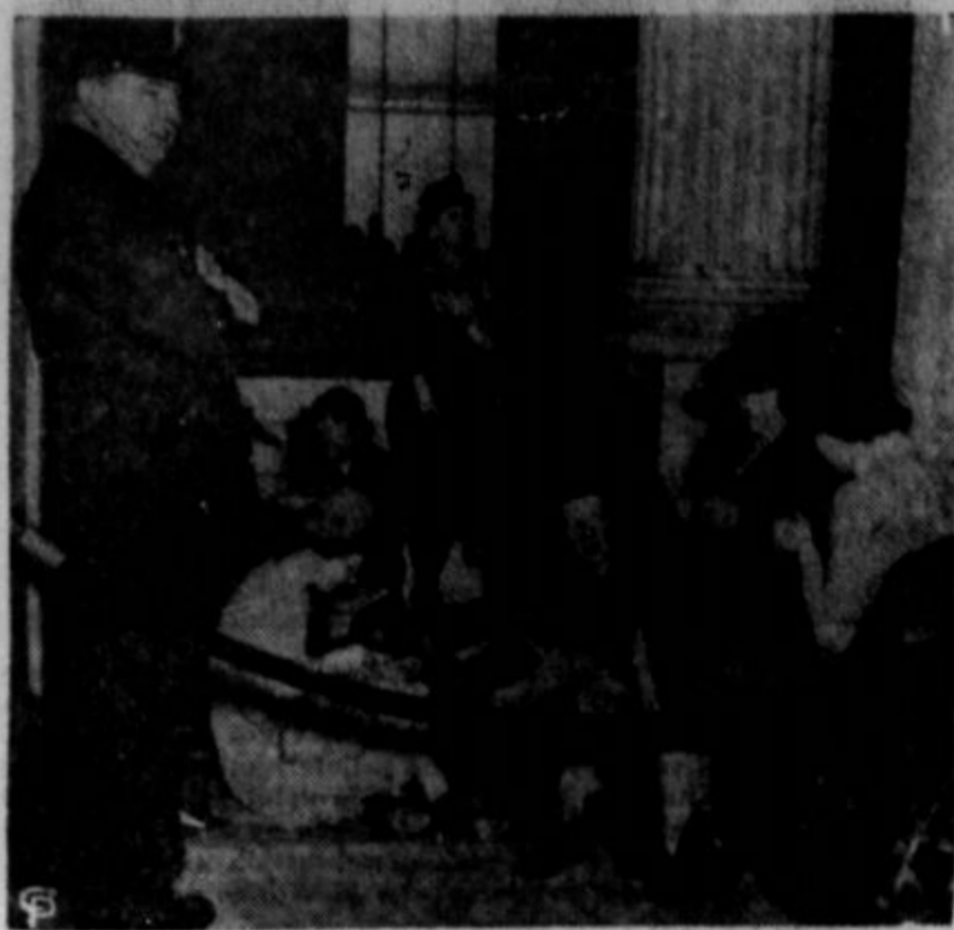
Ko so se vršila pred kongresnim odsekom za vnanje zadeve in nato pred enakim senatnim odsekom zaslišavanja o Rooseveltovem načrtu za podpiranje Anglije, jih je hotelo poslušati tisoče ljudi, a prostora je bilo le za kakih tri sto. Le tisti, ki imajo dovolj vpliva, so si dobili dovoljenje za vstop, drugi pa so se dremjali po hodnikih in zunaj. Ko je bil zaslišan Chas. Lindbergh, se je kar trlo ljudi, največji naval pa je bil, ko je bil pred senat pozvan Wendell Willkie. Gornja slika predstavlja del skupine v sobi senatnega odseka za vnanje zadeve.