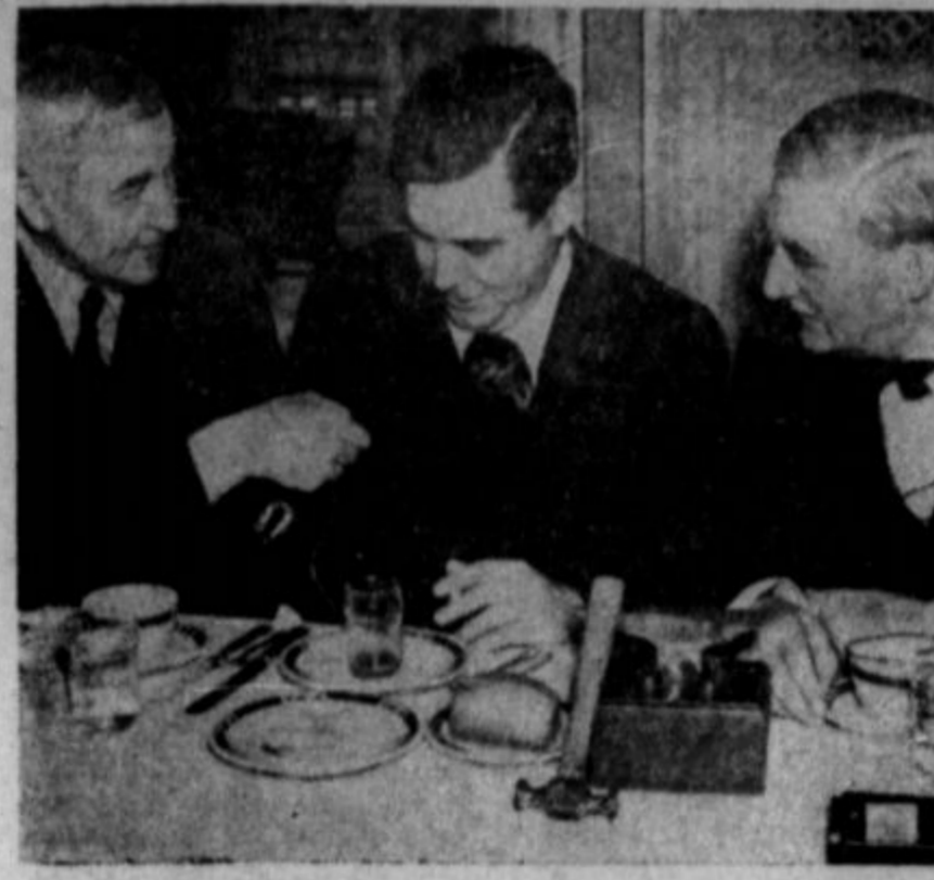
Wendell Willkie je bil prejšnji mesec v Angliji sprejet bolj navdušeno kot pa bi mogel biti katerikoli osebni Rooseveltov odposlanec...