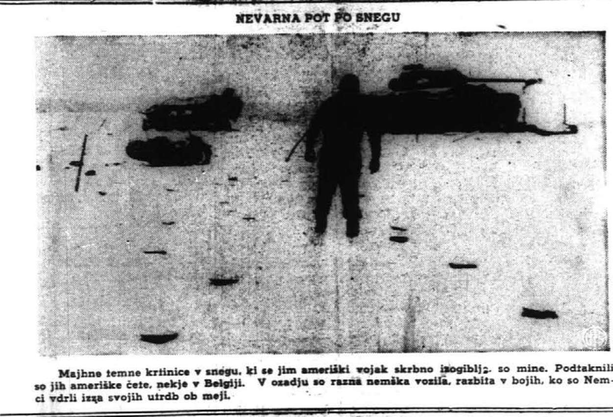
NEVARNA POT PO SNEGU. Majhne temne krtinice v snegu, ki se jim ameriški vojak skrbno izogiblja: so mine. Podtaknili so jih ameriške čete, nekje v Belgiji. V osadju so razna nemška vozila, razbita v bojih, ko so Nemci vdrli izga svojih utrd ob meji.

Berne, Švica. — Zdi se, da Nemčijo pretresajo zadnji zaključni dogodki na odru strašne nazijske igre. Počasi baje prihaja splošni odpor. Ni to kak sam od sebe pojavljen odpor, ampak nekaj prisiljen odpor. Nemci vidijo, da je vse zgubljeno, da je njihov žalostni konec pred vrati in še le zdaj odslavljajo nazizem, da bi rešili kar se rešiti da. Drugače pa so stari ošahni in prevzetni nemški barbarji. V soboto je napadlo nad 1000 ameriških letelich trdnjav Berlin, ki so vrgle na mesto več ti-soč bomb. Poročilo pravi, da se ni dvignilo niti eno samo nemško letalo proti njim, kar je znamenje, da je Nemcem te vrste orožje pošlo. Streljale pa so protizračne baterije in 32 ameriških bombnikov se ni vrnilo z napada. Napad je bil silno učin-