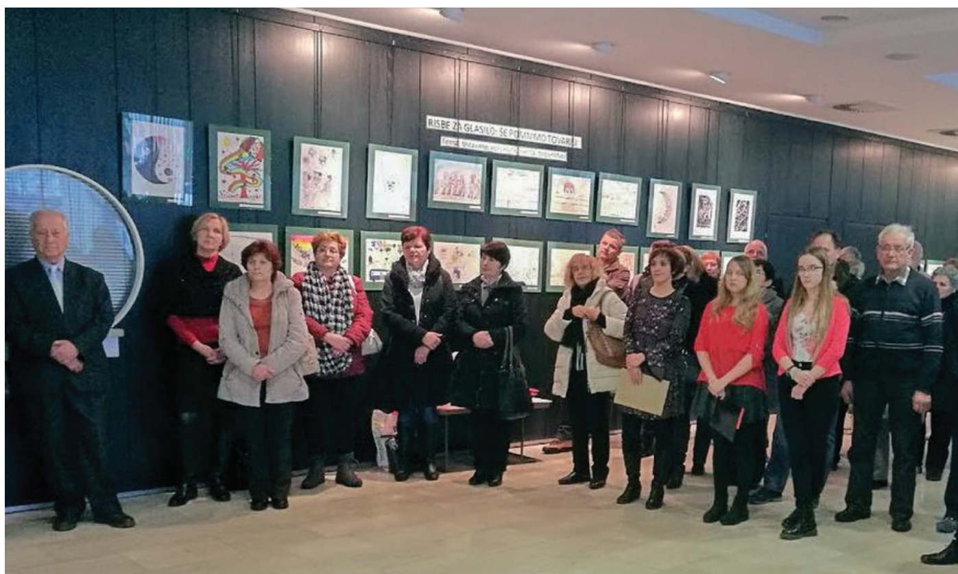
Odprtja razstave se je udeležilo veliko učencev in odraslih.

in literarni izdelki naših učencev dopolnjujejo njihova glasila in koledarje. Organizatorji pa hvaležnost za naše delo izkazujejo s povabilom na zaključ-