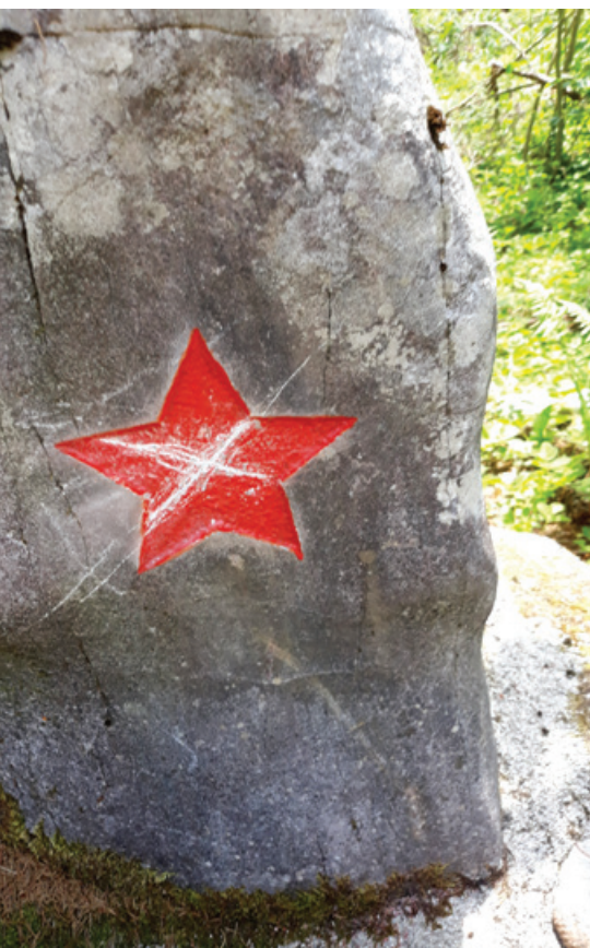
Poškodovano partizansko obeležje na Kočevskem.