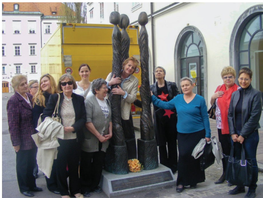
Spomenik na Pogačarjev trgu je delo akademske kiparke Dragice Čadež

Takšen je bil scenarij prvih, zadnjih in edinstvenih (ne samo v Evropi!) ženskih demonstracij pod okupatorjem v drugi svetovni vojni. In kakšen je spomin nanje? Zamolčan, pa tudi izbrisan! ▀