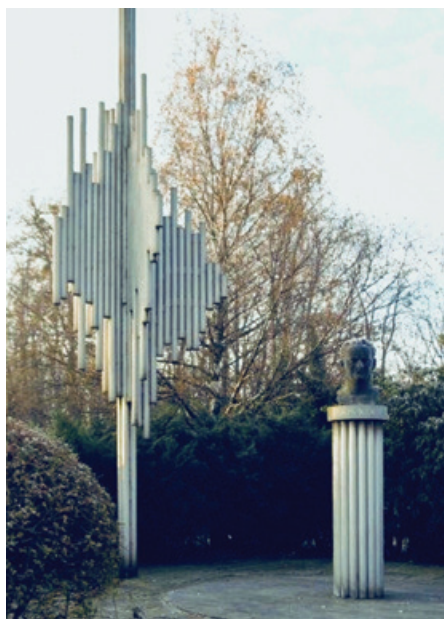
Spomenik Kidriču pred rušenjem