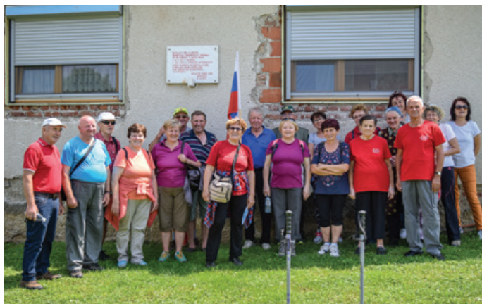
Udeleženci pohoda pred Roganovo domačijo v Sodišincih

Krajevna organizacija ZZB za vrednote NOB Tišina je 16. junija pripravila že sedmi spominski pohod ob obeležjih NOB in osamosvojitvene vojne 1991. Pohoda se je udeležilo trideset članic in članov ter simpatizerjev veteran-