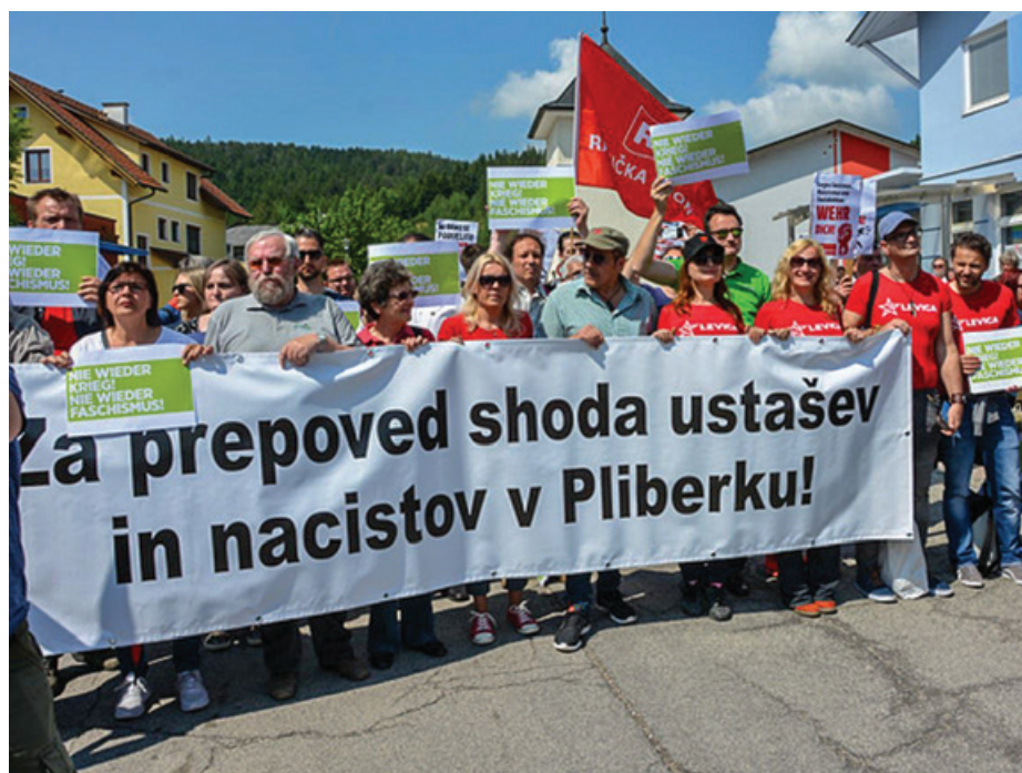
Demonstracij proti zborovanju ustašev se je udeležilo več kot 200 ljudi

skega združenja tako rekoč ni mogoče ločevati med zavestno neonacističnimi in fašističnimi akterji ter drugimi udeleženci, je prepoved prireditve edina možnost in ustreza določilom Avstrijske državne pogodbe iz leta 1955, ki vsebuje prepoved vsakršnega nacionalsocialističnega delovanja.