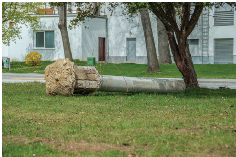
Takole je končal spomenik po rušenju

V Moderni galeriji smo kot matični javni zavod za umetnost 20. in 21. stoletja poleg skupine kulturnikov, umetnikov in umetnostnih zgodovinarjev 15. aprila