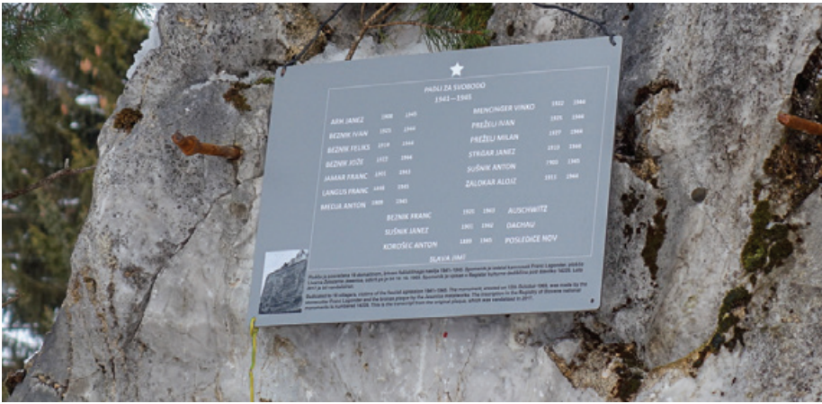
Začasno popravljene spomenik po skrunitvi