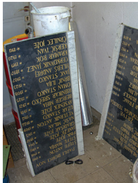
Številne spomske plošče po odstranitvi ostanejo v skladiščih.

Moja izkušnja govori, da največja nevarnost vrednotam NOB ne preti od motenih posameznikov, ki se postavljajo z nacističnimi simboli, demokraciji in mirnemu sožitju so zares nevarne