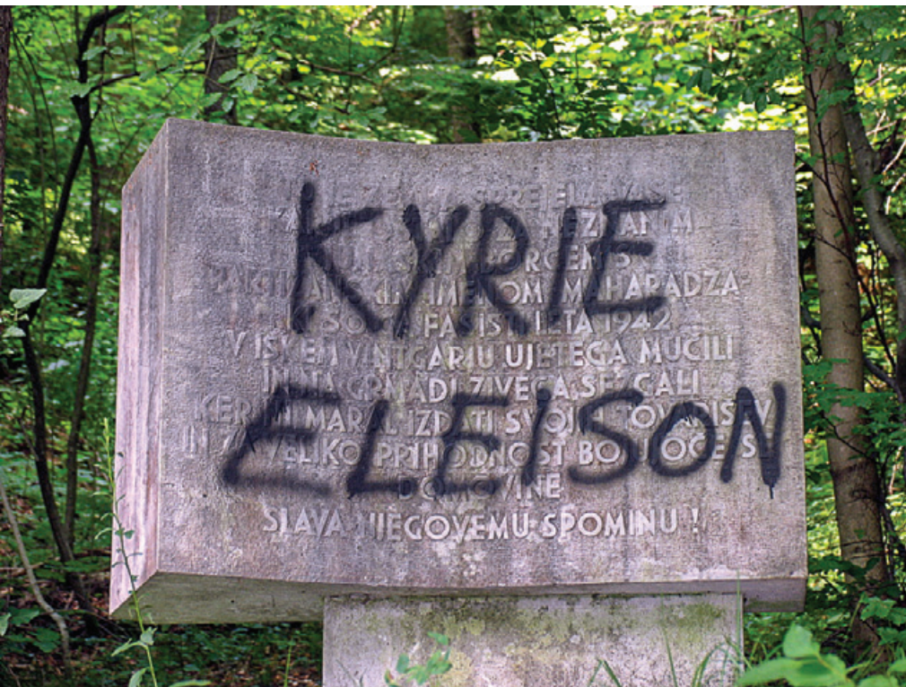
Oskrunjen spomenik v Iškem Vintgarju

Presenetilo me je, kako redko ljudje uničenje opazijo in prijavijo. Žalostna je izkušnja z institucijami, ki bi se morale odzvati na prijavo. Ob prijavi je molčala krajevna skupnost, molčala je občina, tudi na ZB očitno ni nihče prebral e-pošte s prijavo, z Zavoda za varstvo kulturne dediščine pa so odgovorili, da spomenik ni registriran pri njih in zanj niso pristojni. Lastnike, ki so s svojih hiš odstranili spominske plošče, bi rad nagovoril, naj plošče deponirajo v lokalni muzej, vendar si vsaj v primeru Gornje-savskega muzeja tega ne upam stori- ▶