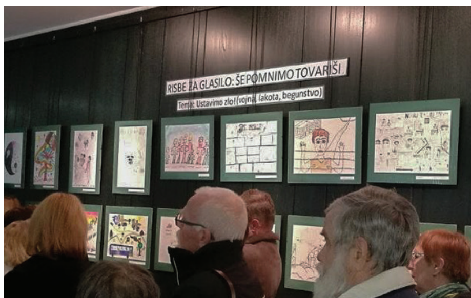
Osnovnošolci so risali in pisali za glasilo Še pomnimo, tovariši

Razstava je v osnovnih šolah vzbudila veliko zanimanje. Pet šol se je odločilo, da bo razstavo v celoti preneslo tudi v svoje prostore. ●