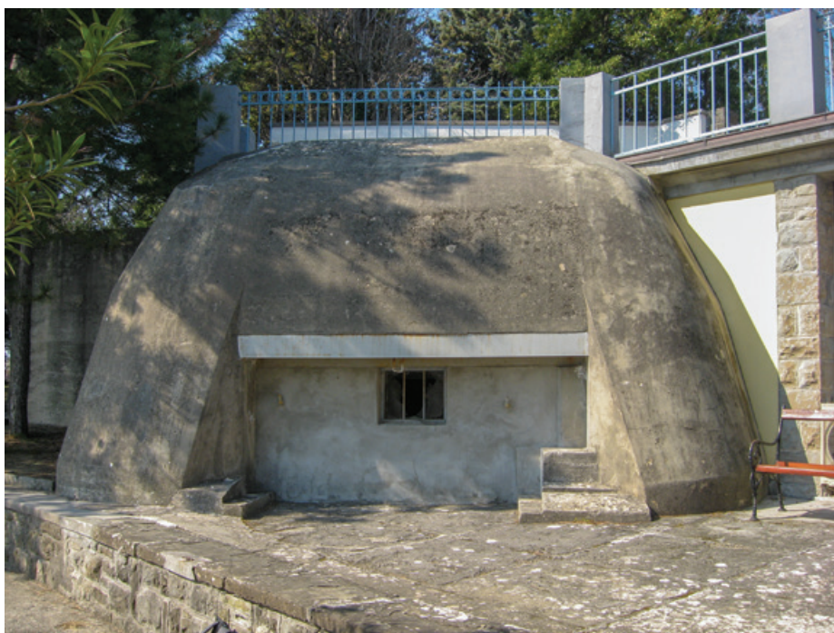
Bunker v kompleksu bolnišnice v Valdoltri

Avtor članka prosi vse, ki karkoli vedo o nemškem utrjevanju slovenskega Primorja, naj se mu oglašijo na elektronski naslov: rok.filipic@mors.si