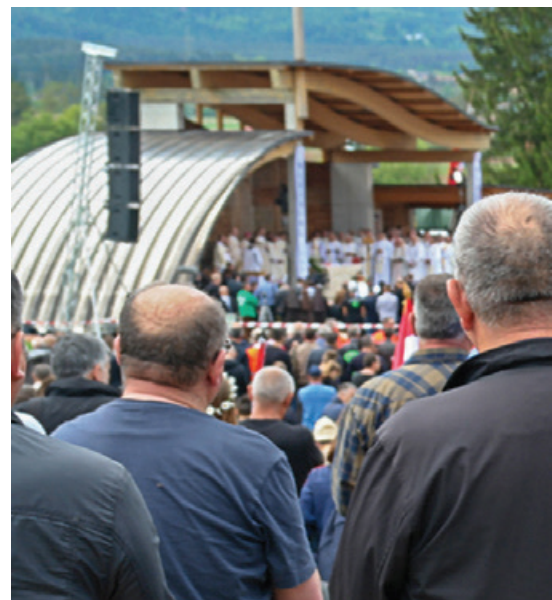
Ustaških grozodejstev se ne da izbrisati iz spomina