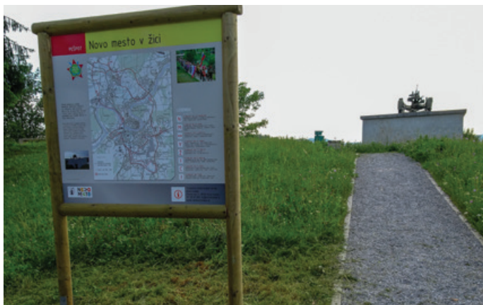
Tabla je vsebinsko zelo podobna prvi postavljeni informativni tabli za pot Novo mesto v žici, ki stoji v bližini gostišča Loka. Na njej so zemljevid poti in podatki o ključnih dogodkih v Novem mestu v času NOB. Bunker je sicer tradicionalno zbirališče pohodnikov, ki se na dan upora proti okupatorju podajo na priljubljeno novomeško pot.

Na območju spomenika bunkerja s topom na Drski, kjer so v zadnjih letih člani krajevne organizacije ZB NOB Drska v sodelovanju s krajevno skupnostjo Drska uredili pešpot in stopnice za vstop v objekt, so tokrat postavili informativno tablo. Bunker namreč leži ob zgodovinsko-rekreativni pešpoti Novo mesto v žici, zato je bila postavitev informativne table logično nadaljevanje urejanja okolice.