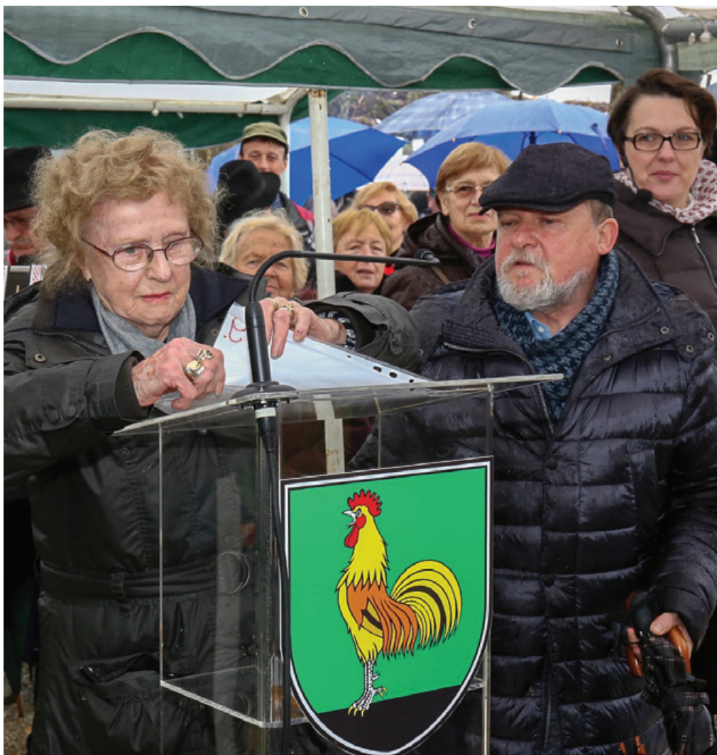
Tradicionalna prireditev na Javorovici

Vir: Boris Paternu: Slovensko pesništvo upora, 1. knjiga. Ljubljana: Mladinska knjiga, Partizanska knjiga, 1987, str. 347.