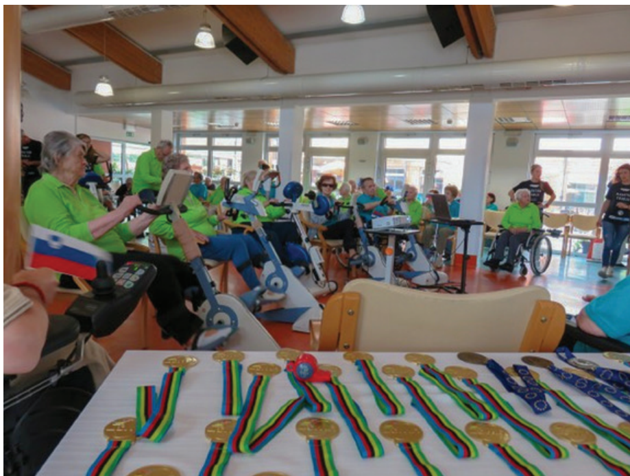
V Domu starejših občanov Fužine so izpeljali drugi seniorski maraton Franja

V dveh urah so stanovalci in stanovalke prevozili skupaj 198 kilometrov in krepko izboljšali lanski rezultat. Najmlajši udeleženec je štel 76 let, najsta-