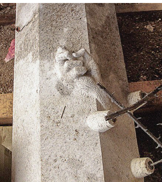
Avtor idejne zamisli spomenika pred Kazino je Jože Plečnik

Zamolčan je bil preprosto zato, ker je bilo to samó žensko gibanje, ki pa na splošno, ne samo v zgodovinski znanosti, nima nobene teže. Obrazi iz zgodovine in zgodovinskih kronik so samo moški. Če so bojevniki iz NOB priznavali svoje sobojevnice v socialističnih časih, potem je ženski boj samostojna Slovenija ne samo marginalizirala, ampak je želela nanj preprosto pozabiti. In to zato, ker je žensko gibanje moteče, zlasti pri razgraditvi socialne države in pri vnovični pokoritvi žensk neopatriarhalizaciji. Nosilka pglavitnega boja proti ženski emancipaciji pa je Rimskokatoliška cerkev, ki je zahtevala odstra-