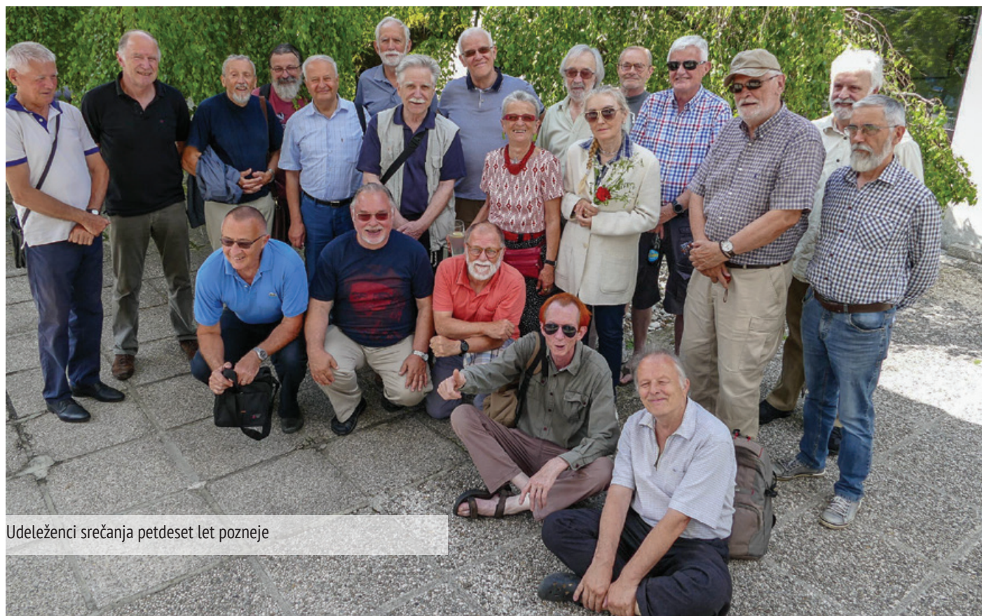
Udeleženci srečanja petdeset let pozneje

Tolikšne mere odkritosti in poštenosti, kot smo jo doživljali takrat leta 1968, nismo nikdar več – mladost, hvala ti za to doživetje! Bili smo uporniki in najbolj naravna podlaga za uporništvo sta človekova potreba po pravičnosti in občutek za poštenost. Človek je človek zato, ker se tega zaveda in tako tudi ▶