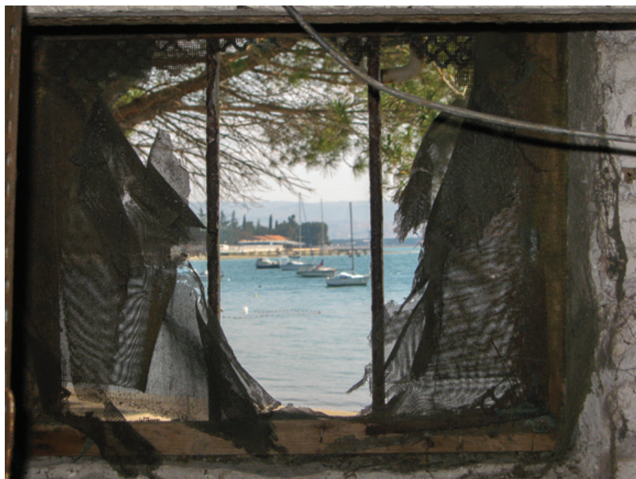
Pogled skozi strelno lino bunkerja v kompleksu bolnišnice Valodoltra

graditvijo obrambnega sistema v Operacijski coni Jadransko primorje. Z obstojem dveh organizacij, odgovornih za izvajanje utrjevalnih del, so nujno morala nastati določena nesoglasja med njima, zlasti še ko se je količina denarja, namenjena za utrjevalna dela, začela krčiti. Razmejitev med obema organizacijama je šla v smeri, da je bila organizacija Pöll odgovorna za zgraditev preprostejših poljskih fortifikacij, kot so bili protitankovski jarki, zaklonilniki, pri-