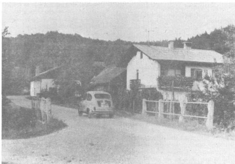
Stranskovaška dilema: majhne razvojne možnosti za majhno vas