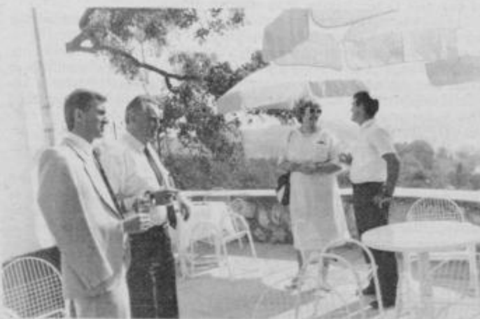
Terasa gostišča na Gorci bo gotovo najpriljubljenejši prostor za vse goste.