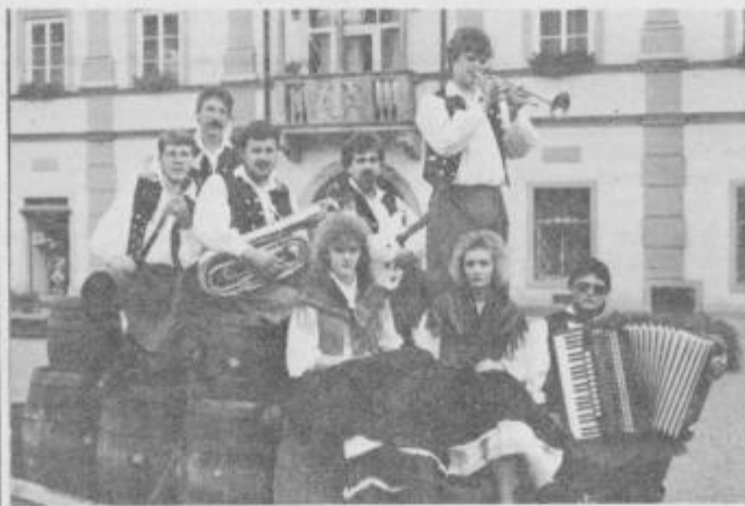
IDILA iz Cirkovc se bo letos drugič predstavila na festivalu. Lani so dosegli bronasto Orfejevo značko.