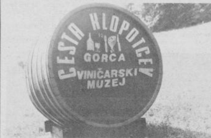
Simbol ceste klopotev — sod — nas vabi na Gorco.