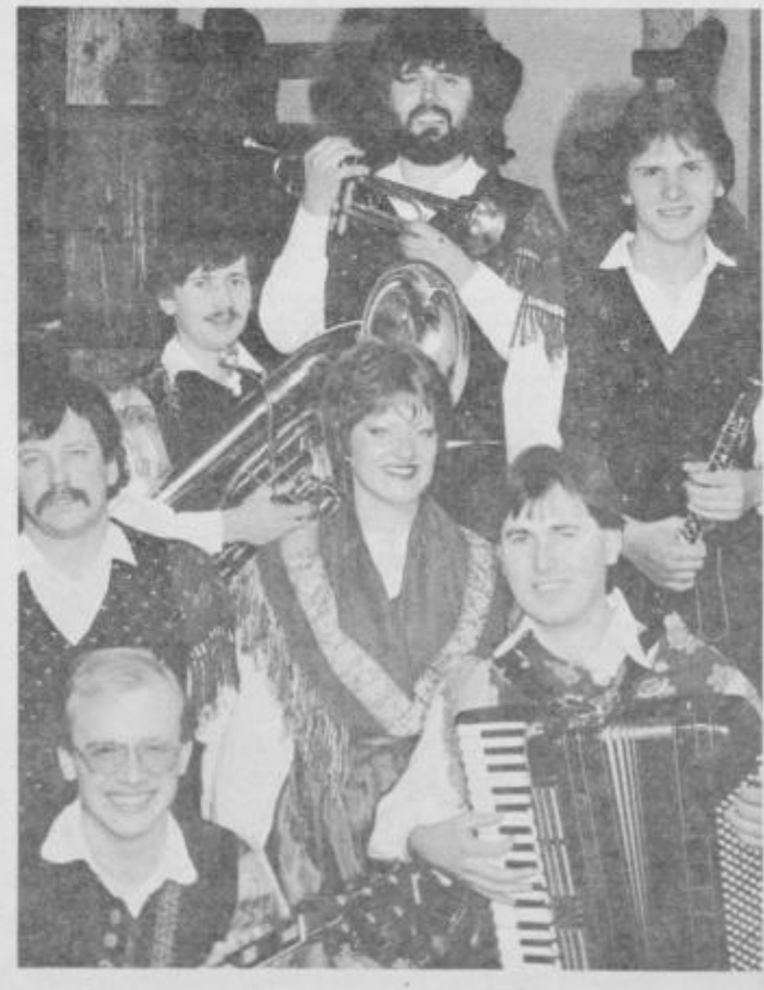
VINIČARJI iz Maribora bodo letos že petič nastopili pred ptujskim občinstvom na festivalu. Doslej so dosegli bronasto, dve srebrni in zlato Orfejevo značko.