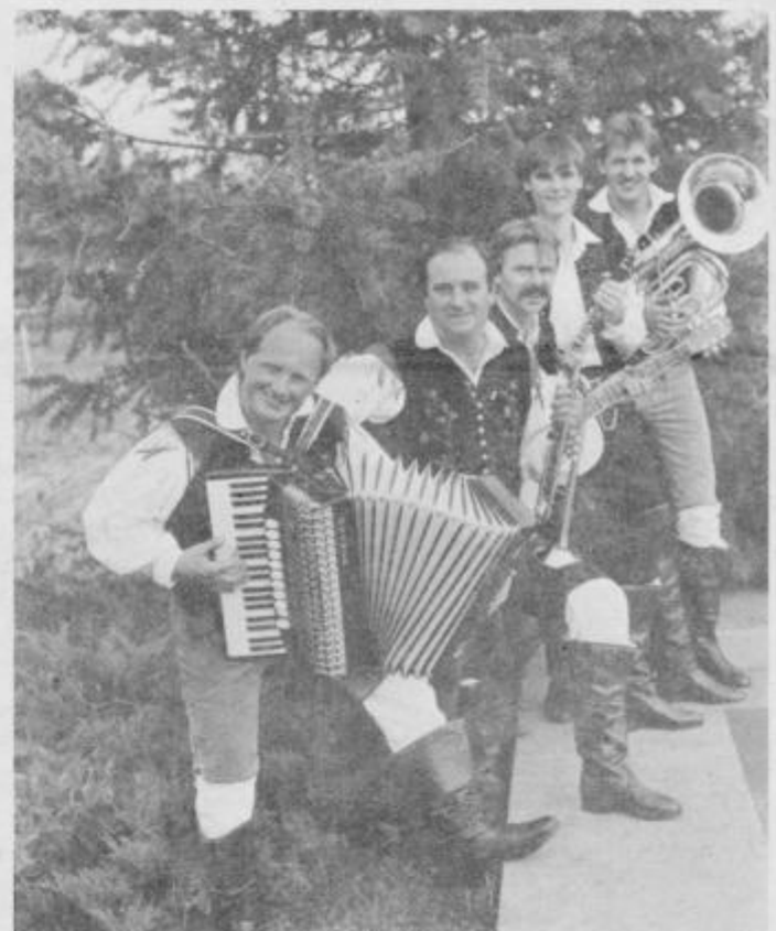
PTUJSKIH PET iz Gorišnice se bo drugič predstavilo na festivalu domače zabavne glasbe v Ptuj. Lani so dobili bronasto Orfejevo značko.