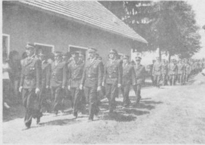
Parada ob 16. dnevu gasilcev.