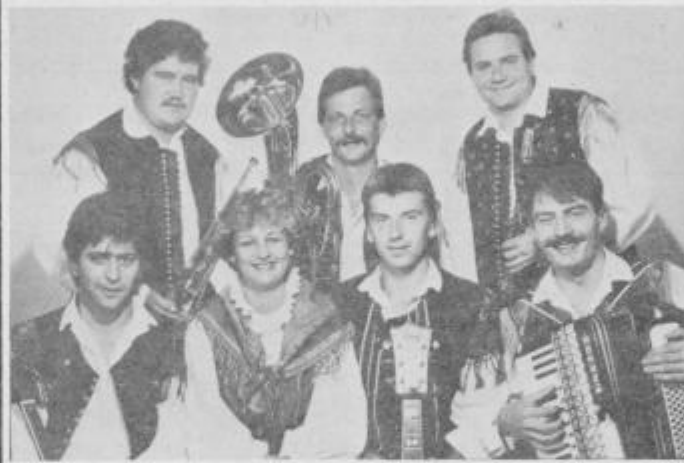
PRIJATELJI iz Ptuja so že dvakrat sodelovali na festivalu domače zabavne glasbe v Ptuj in obkraj so bili bronasti.