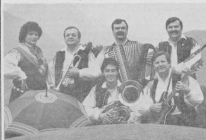
KARAVANKE iz Lesc imajo s festivala že bronasto Orfejevo značko. Letos so naši gostje drugič.