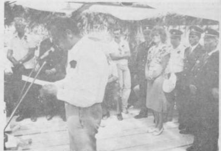
Slavnostni govornik na proslavi ob dnevu vstaje, 16. dnevu gasilcev in 50-letnici GD Pršetinci.