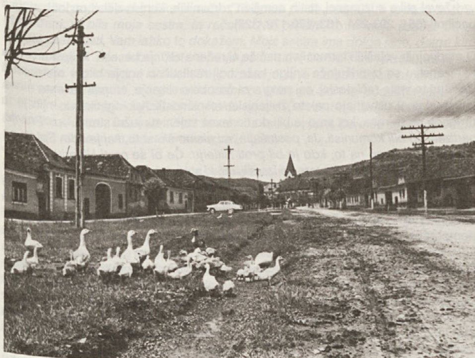
Vas, ki je danes ni več; Transilvanija v sedemdesetih letih (foto: M. Fister)

V prvi razdelek je uvrščenih petnajst pripovedi, kako so ljudje na lastni koži doživljali preganjanje njihove materinščine in so se otroci knjižne slovenščine učili le naskrivaj, ko so jim matere vcepljale ljubezen do domače literature (37), saj so bili slovenski napisi sodeželanom napoti ne le pri postajah križevega pota v cerkvi (82), ampak tudi na zvonovih in celo nagrobnih spomenikih (107). Tako je nekdo nostalgčno dejal: "Zdaj bomo pa slovensko pesem slišali še samo na pogrebih. Bomo pa na vse pogrebe šli, da jo bomo vsaj še tam čuli." (95) Otroci, prihajajoč iz šole, so pretresali do mozga svoje starše, pozdravljajoč jih: "Heil Hitler". (101-102) Sin je po vrnitvi z zagovora na občini jokal in rekel "Ati, boglonaj, da ste me tako vzgojili, da tudi v najtežjih urah nisem zatajil svojega materinega jezika." (116)