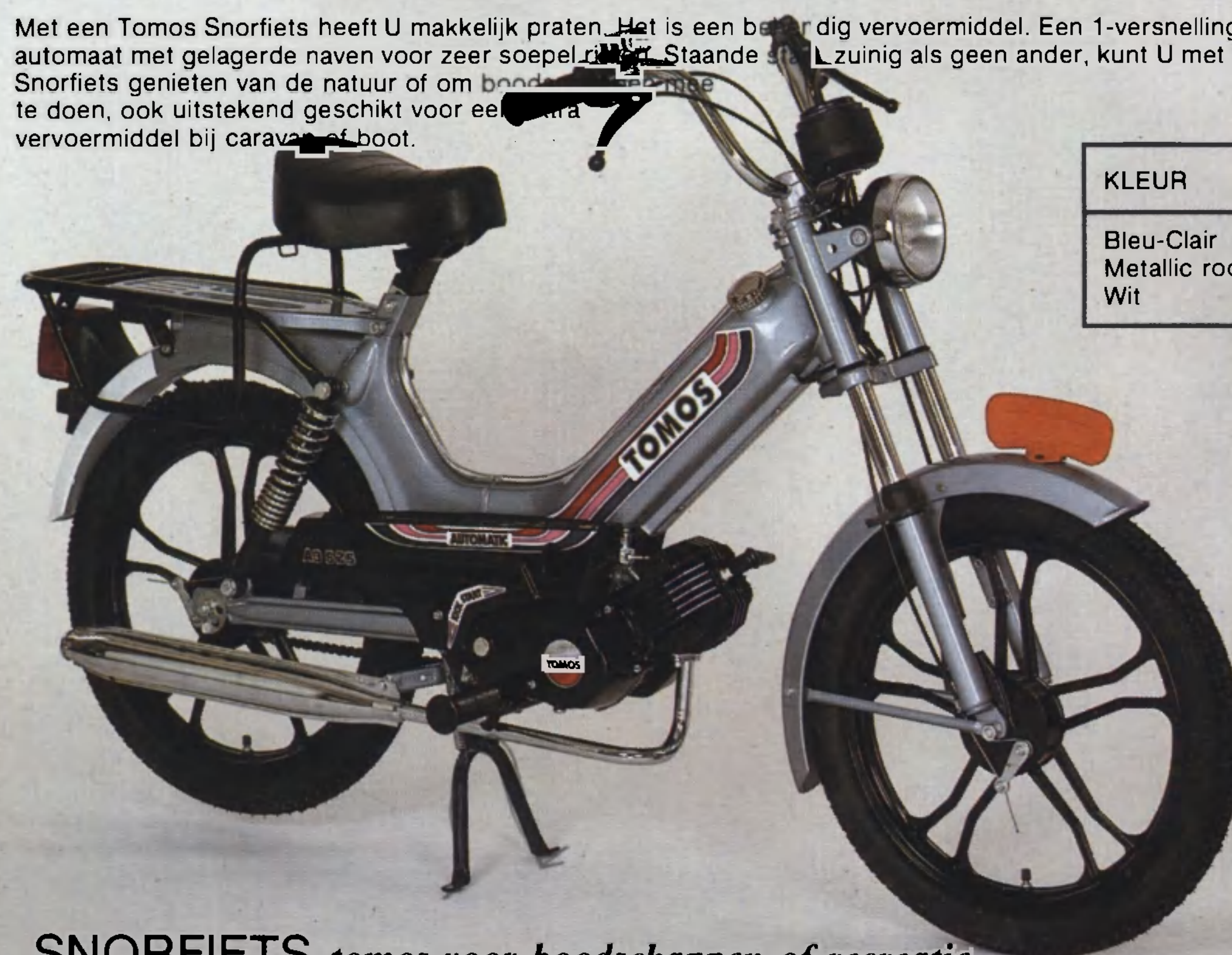
SNORFIETS tomos voor boodschappen of recreatie