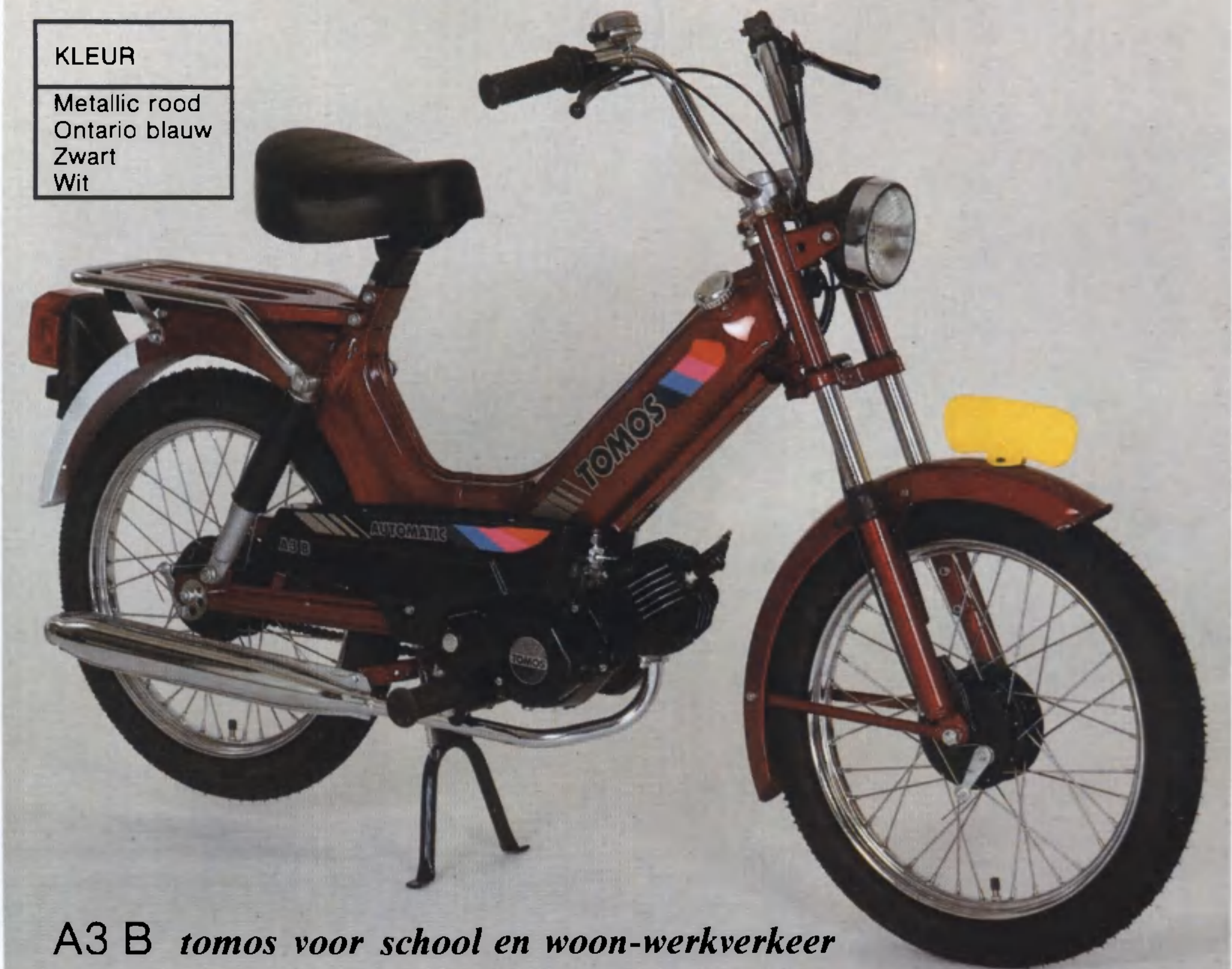
A3 B tomos voor school en woon-werkverkeer