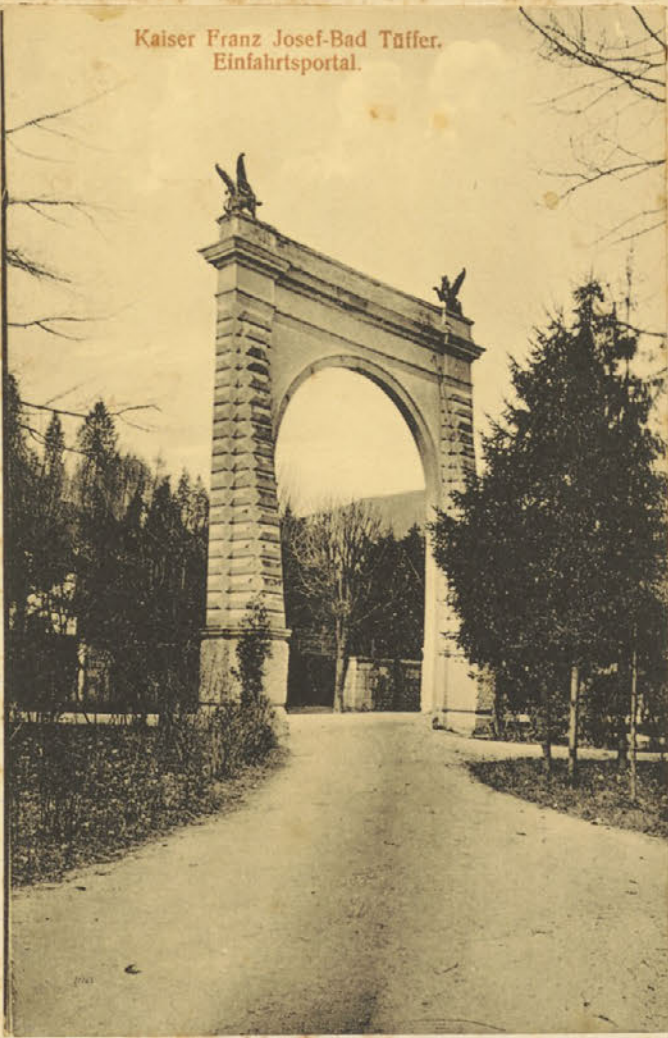
Kaiser Franz Josef-Bad Tüffer. Einfahrtsportal.

u. z. mit der Luftschiffen, die fast dreifach mehr sind. Seit um 10 Uhr vermittelnd stieg die obere Luftschiff auf die Luft- zuchtstraße. Zum Öffnen besuchte ich mehrere Wohnungen auf Fußgänger von der Obsthühler Straße, welche von der Obsthühler Straße, dass der Besatz bestand. und mit Zigaretten und waschen mit wurde.