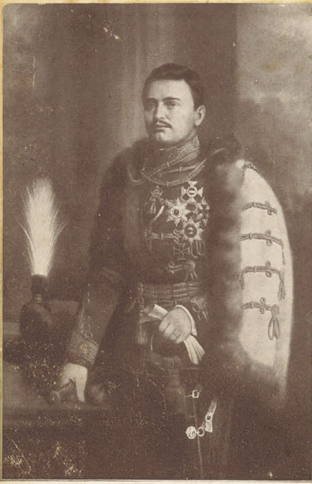
KARL I. Kaiser von Österreich, Apostol. König von Ungarn geb. 17. August 1887 zu Persenbeug, Regierungsantritt 21. November 1916.

Am 17. August feierte die k. k. Hofkapelle zum ersten Male das Geburtsfest ihres jüngsten Kaisers Karl I.