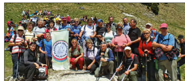
Hajdinski planinci in Draženčanke so na vrhu Golice naredili skupinski posnetek za Hajdinčana.