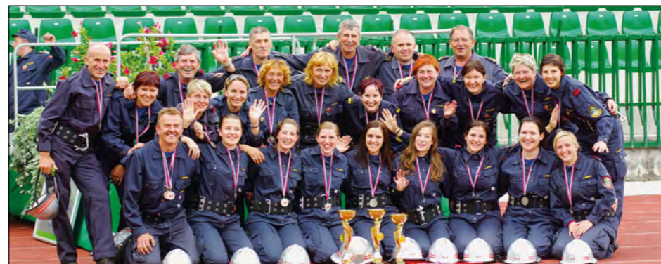
Veseli hajdoški gasilci in gasilke po razglasitvi rezultatov na državnem tekmovanju v Velenju. Gasilkam vratove krasijo srebrne, članom pa bronaste medalje.

Tekmovanje se je začelo v jutranjih urah. Prvi na vrsti so bili člani B. Ostali dve ekipi in kar nekaj domačih gasilcev jih je podpiralo iz tribun. Vajo so zaključili s časom 39,00 sekunde, a žal prejeli 5 kazenskih točk. Sledila je vaja razvrščanja in štafetni tek z ovirami.