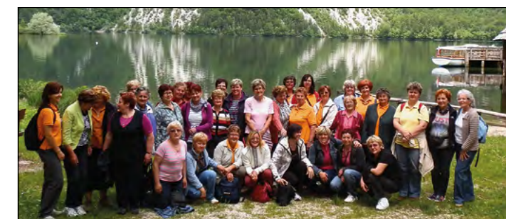
V soboto, 2. junija, se je ekipa Draženčank odpravila na ekscurzijo po Gorenjski.