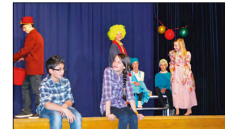
Otroška gledališka skupina domačega KD z igro O žalostnem klovnu in zaljubljeni princesi