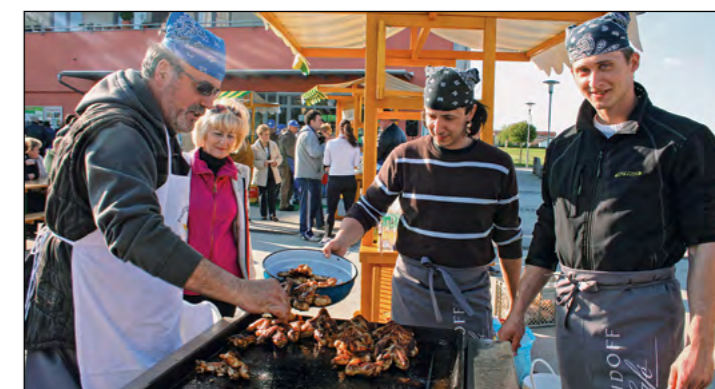
Kuharska ekipa VO Sp. Hajdina se pri svojem delu ni dala motiti, na pokušnjo dobro pečenih perutnic pa se je povabila tudi direktorica občinske uprave.