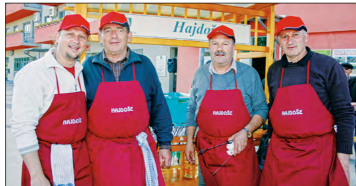
Ekipa kuharjev VO Hajdoše je po videzu kar izstopala. Vse pohvale!