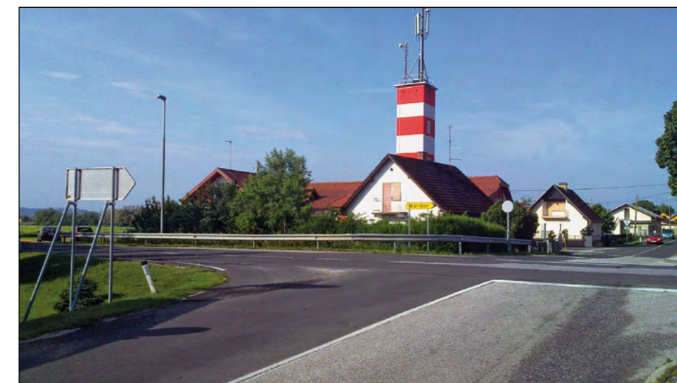
V maju je bila na Spodnji Hajdini uspešno izvedena rušitev nenaseljene stanovanjske hiše.

Ob podpori in dobri volji vseh jim je kljub administrativnim preprekam uspelo ujeti zastavljen rok, kot je bil dogovorjen na začetnem operativnem sestanku na sedežu občine, ki