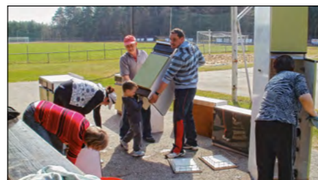
Članom ŠD Gerečja vas so priskočile na pomoč pri ureditvi novega klubskega bifeja.

Vsako leto zapored so članice DŽD zadolžene za okrasitev mlaja in po dosedanjih izkušnjah okrasje iz krep papirja hitro »podleže« vremenjskim vplivom. Zato so letos poskusile izdelati tradicionalno okrasje iz popolnoma novega materiala – uporabile so ekološke vreče za smeti. Ker je ponudba tega materiala na tržišču zelo pestra tudi v barvah, so za izdelovanje verig in trakov uporabile kar nekaj različnih barv in debelin ekoloških vreč za smeti. Delo je bilo poučno in zabavno, kasneje pa se je izkazalo, da so izdelki uporabni in veliko bolj vzdr-