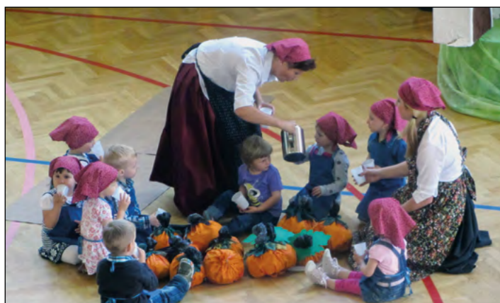
Vijolična igralnica je imela bučijado.