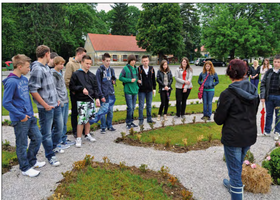
Naravoslovni dan na Turnišču