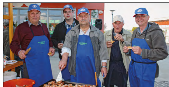
Kuharji VO Slovenja vas so bili zbrani v velikem številu, njihove pečene perutnice pa so bile posebej pohvaljene. Jedci že vedo, kaj je dobro ...