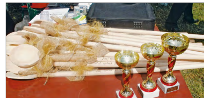
Simboli letošnjega tekmovanja – pokali in kuhalnice velikanke

Magda Intihar