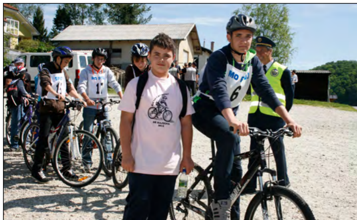
V cestni vožnji so mladi kolesarji prikazali varno vožnjo.