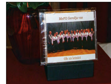
Nova zgoščenska z naslovom Ob 10-letnici, ki jo je MePZ posvetil sovaščanom.

Dodatna poživitev in popestritev celotnega glasbenega večera je bil tudi ansambel Štajerski baroni, katerega ustanovni član je tudi zborovodja