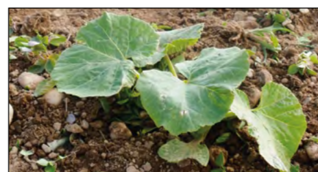
Čez štiri tedne – okopane in dodatno pognojene buče