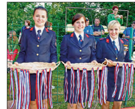
Hajdoške gasilke so z velikim veseljem delile zlata, srebrne in bronaste medalje.