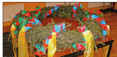
Venec za mlaj v klasični okrasitvi, vendar tokrat iz vzdržljivega materiala, ki so ga naredile Gerečjevaščanke.