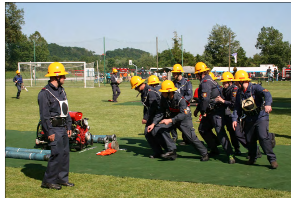
V Hajdošah so se že dvajsetič zapored srečale najboljše moške in ženske gasilske desetine iz vse Slovenije.

V Hajdošah, v športnem parku, je 19. maja potekalo že 20. tekmovanje za pokal Hajdoš in hkrati tudi za pokal GZ Slovenije, na katerem so se pomerile najboljše slovenske moške in ženske A in B ekipe. Uspešno so se na domačem terenu odrezale vse tri hajdoške ekipe, saj so stale na zmagovalnih stopničkah.