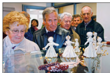
Iz ličja je mogoče narediti veliko zanimivih izdelkov in Hajdošanke so nas o tem nedvomno pričale.