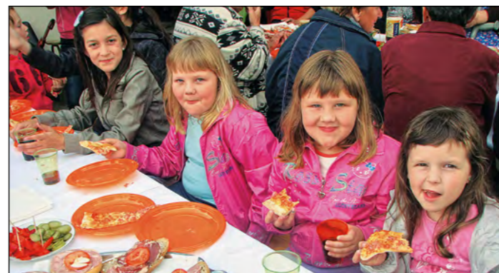
Zadnji dan druženja otrok ob šmarnicah