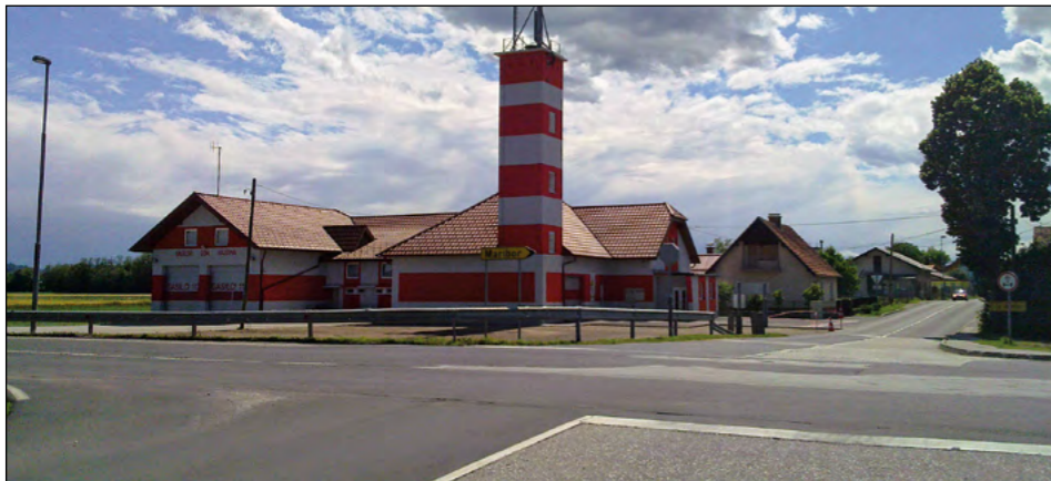
Pred gasilskim domom na Hajdini je zdaj veliko prostora, del tega pa naj bi bil kmalu porabljen za izgradnjo krožišča.