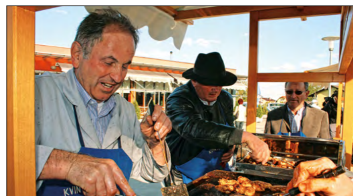
Ekipa VO Skorba je ob perutnicah ponudila še skorbski kvinton.