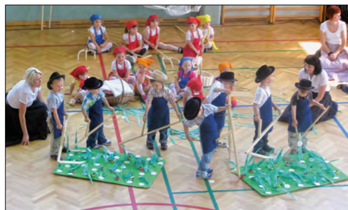
Travo so kosili otroci zelene igralnice.

Ob zvokih kitare so otroci tudi zarajali. Predstavili so se nam še najstarejši otroci – otroci rdeče igralnice: z njimi smo se preselili na kolino. Bilo je precej petja, pogovora in plesa in kar je najpomembnejše – imeli so tudi prašička in mesarje. Naša prireditev se je bližala koncu, vendar še ni bila končana: preselili smo se na igrišče vrtca, kjer nas je čakalo presenečenje – torta, ki je bila tako velika, da je je bilo dovolj za vse. Našemu vrtcu smo skupaj zapeli pesem za rojstni dan in mu zaželeli še veliko nasmejanih in razi-