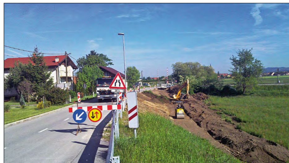
Od nadvoza Draženci do križišča z železniško progo so končana dela v sklopu izgradnje hodnika za pešce in javne razsvetljave.