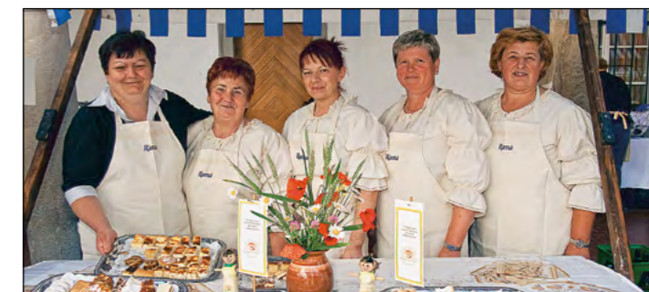
Draženske gospodinje so letos sodelovale na Ramini stojnici in obiskovalce državne razstave dobrot (na njej je bilo letos predstavljenih 1093 nagrajenih izdelkov) kar malo razvajale z odličnimi sladkimi dobrotami.