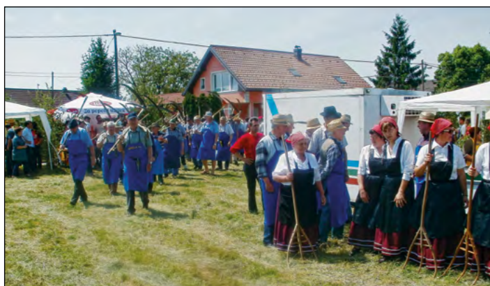
Prihod koscev na travnik

Nedelja, 20. maja, je bila eden od redkih majskih dni, ko ni deževalo. In če je tovrstni prireditvi naklonjeno vreme, gre tako rekoč vse kot po maslu. Takšen je bil zaključek ob uspešno izpeljani že 9. tradicionalni prireditvi Košnja trave nekoč, ki jo v sodelovanju z VO in PGD Gerečja vas ter s pomočjo sponzorjev in donatorjev vsako leto organizira DŽD Gerečja vas na »Nemčevem« travniku v Gerečji vasi.