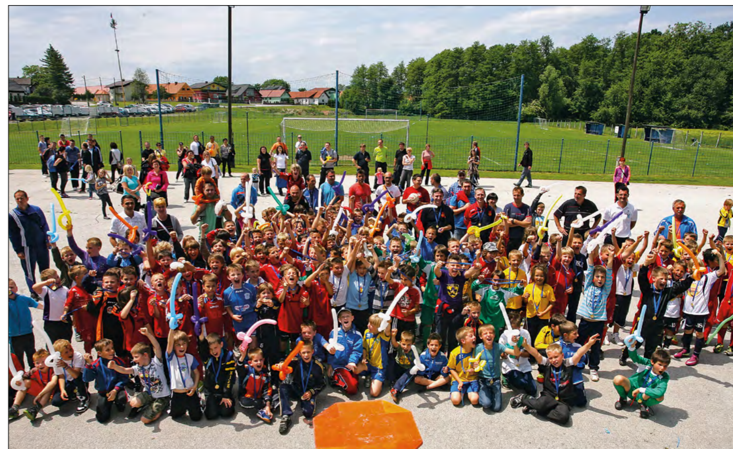
Utrinek z zaključne nogometne revije za mlajše cicibane U8, na kateri je nastopilo 14 ekip.