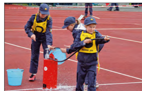
Mladi gasilci so se na mestnem stadionu Ptuj odlično znašli ...

Na Ptujju je 2. junija potekalo državno mladinsko gasilsko tekmovanje, ki ga je v sodelovanju z Gasilsko zvezo Slovenije in MO Ptuj uspešno organizirala Območna gasilska zveza Ptuj. Nastopilo je 189 enot pionirk, pionirjev, mladink in mladincev, skupaj torej 1900 mladih.