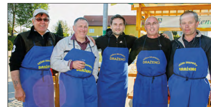
Domiselna pri svojem delu je bila tudi moška kuharska ekipa VO Draženci.