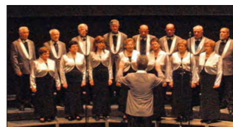
Zbor iz Gerečje vasi je zapel tudi na območni reviji pevskih zborov na Ptujju.

Ko smo se članom MePZ DŽD Gerečja vas pridružili na vajah, smo jim zastavili pravzaprav zelo preprosto vprašanje: »Koliko pesmi ste se naučili v vseh teh letih?« Odgovor je bil skoraj v en glas: »Približno sto.« Mogoče šteto, ki se odraža v kiticah, besedah, zlogih in ne nazadnje v notah, zvokih in glasovih, v urah, dnevih, letih ... In vsaka od teh pesmi ima svoje poglavje v tej 10-letni zgodbi.