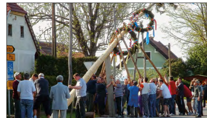
»Hoooooruk« in mlaj bo kmalu postavljen.