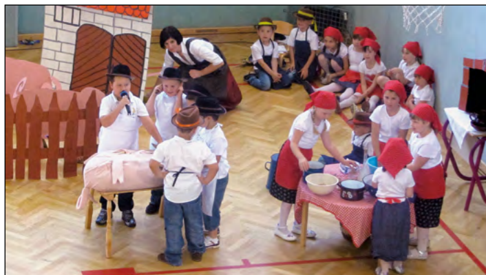
Otroci rdeče igralnice na kolinah