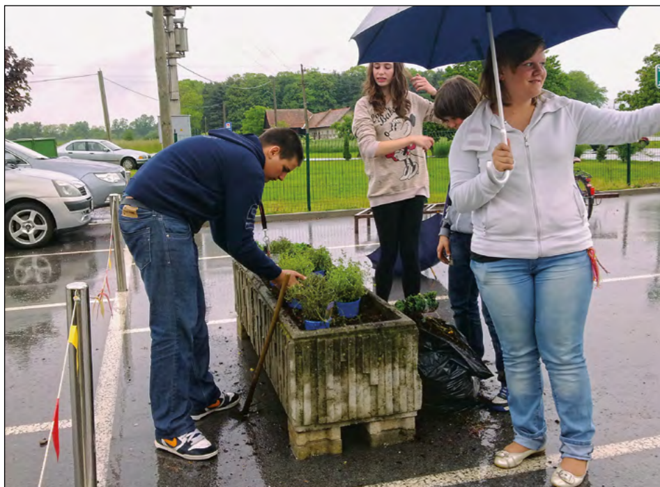
Pred OŠ Hajdina so učenci posadili svoja zelišča