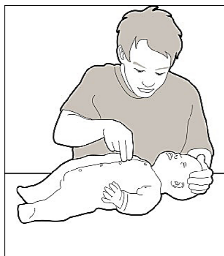
Masaža srca pri dojenčku

Če si otrok kakšen predmet potisne v uho, ničesar ne naredimo sami, gremo takoj k zdravniku, ki poskuša s posebnimi pripomočki odstraniti predmet. Če otrok potisne predmet v nos in tujek vidimo, poskusimo otroka pripraviti do tega, da ta predmet izpihne – če je otrok tega sposoben. V nasprotnem primeru poiščemo zdravniško pomoč.