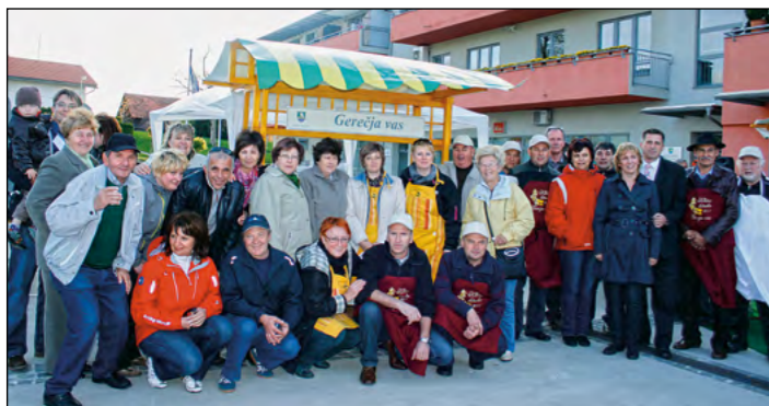
Kuharska ekipa VO Gerečja vas je bila letos najštevilnejša.