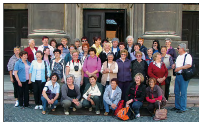
Hajdinčanke pred cerkvico sv. Martina v Sombotelu

Majski izlet Društva žena in deklet občine Hajdina se je začel veselo in bil poln pričakovanj. Tokratni cilj so bili sosednja Avstrija in kraji, ki jih večina izletnic še ni videla. Jutranja vožnja proti Gradcu je minila v znamenju odličnih sirovih štručk, belega kruha in drugih dobrot, ki so jih pripravile članice. Za srečo na poti je vsaka naredila še požirček domačega borovničevca.