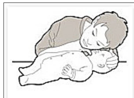
Preverjanje dihanja: GLEJ, POSLUŠAJ, OBČUTI. (vir: svetovni splet)

Poškodbe in krvavitve niso prihranjene nobenemu otroku. Manjše rane očistite s fiziološko raztopino ali, če le-ta nimate pri roki, pod tekočo vodo, da odstranite umazanijo in jo pokrijte z obližem. Večjo krvavitev zaustavimo tako, da preko sterilnega povoja, čistega kosa blaga ali kosa oblačila močno pritismo neposredno na mesto krvavitve. Če je mogoče, poškodovani del telesa dvignemo nad raven srca. Vzdržujemo pritisk in napravimo kompresijsko obvezo: na sterilno gazo oz. material, ki smo ga pritisknili na krvaveče mesto, položimo cel povoj ali kakršen koli drug večji zvitok, ki ga imamo na voljo, ter nato vse to s krožnimi zavoji drugega povoja čvrsto pritrdimo, da se krvavitev zaustavi. Pri tem opazujemo barvo uda, saj lahko obvezo namestimo premočno (pomodrel ali bled in hladen ud). Kompresijsko obvezo zato preverimo vsakih 5–10 minut. Pravilno nameščena kompresijska obveza mora zaustaviti krvavitev iz poškodovane žile, ne sme pa zadržati uda. Če je mogoče, poškodovani ud namestimo v opornico ali trikotno ruto, ga dvignemo nad raven srca in poiščemo zdravniško pomoč. Če je v rano zapičen kakšen predmet, ga ne odstranjujemo, ampak rano povijemo skupaj z njim.