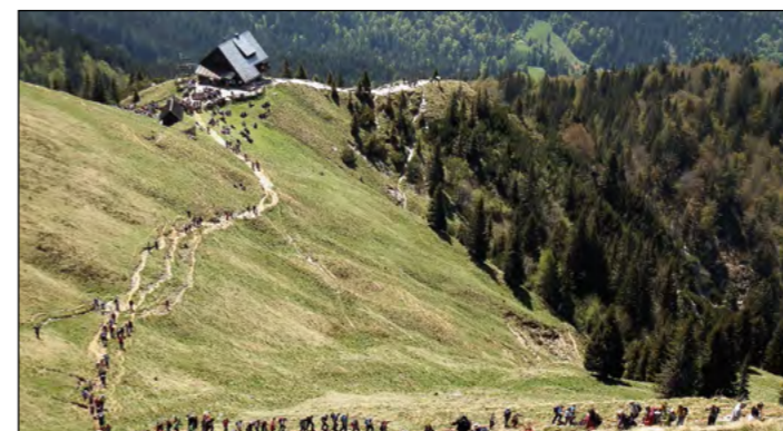
Koča na Golici in vijugasta pot do vrha Golice na nadmorski višini 1835 m