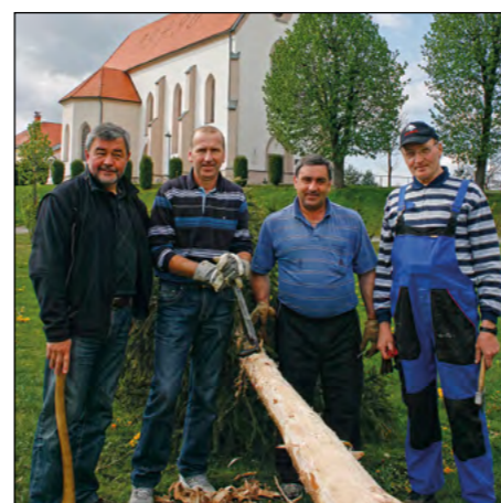
Ekipa mož, ki je letos poskrbela za postavitve mlaja na občinskem trgu.

Občina Hajdina je na osrednjem občinskem trgu 21. aprila pripravila predpraznični dan druženja za občanke in občane. Dogodek so posvetili prazničnemu 27. aprilu in 1. maju. Odziv obiskovalcev je bil izjemno dober, dogodek pa je spremljalo tudi lepo vreme.