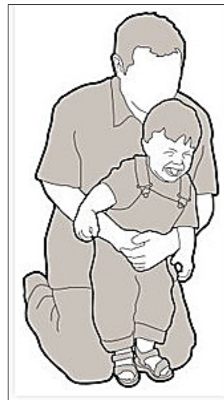
Heimlichov prijem

Opekline ne prizadene samo kože na površini. Vročina prodre tudi do žil pod kožo in jih tako razširi, da iz njih uhaja brezbarvni del krvi (plazma). Pri manjših opeklinah se plazma nabere v mehurju, če je opekline večja, pa kaplja z opečene površine. Hude opekline in oparine lahko izzovejo šok.