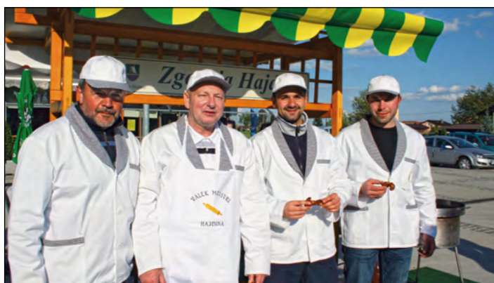
Kuharska ekipa VO Zg. Hajdina je spekla odlične perutnice, poskrbela pa je tudi za lep videz vseh kuharskih mojstrov.