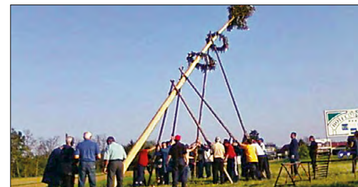
Tudi v Hajdošah so postavili mlaj.

se vaščani v zelo velikem številu zbrali ob kresu, ki je zagorel pod budnim očesom gasilcev iz sosednjega gasilskega društva Hajdoše. Plameni so kar nekaj časa osvetljevali nočno nebo, sami pa smo prijetno druženje ob kletpetu, dobri jedaci in pijači – za kar so poskrbeli organizatorji kresovanja in vaški kletarji – kasneje nadaljevali ob ribniku. Ko je svoje mehe raztegnil še