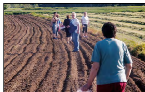
Vzorno pripravljena njiva, na katero so članice v začetku maja posadile bučna semena.