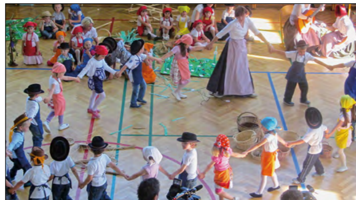
Pletarstva so se lotili otroci rumene igralnice.