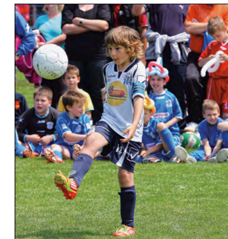
Zaključna revija U8, na kateri so se najmlajši nogometaši zelo izkazali.