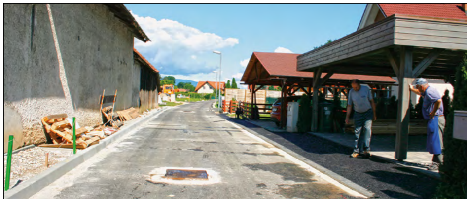
Cesta Gajec v Gerečji vasi, kjer so 14. junija polagali zgornjo plast asfalta