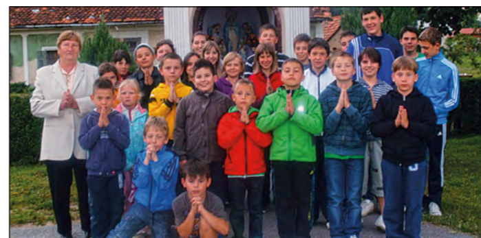
Letošnji bogat »šopek šmarnic« pri kapeli v Gerečji vasi