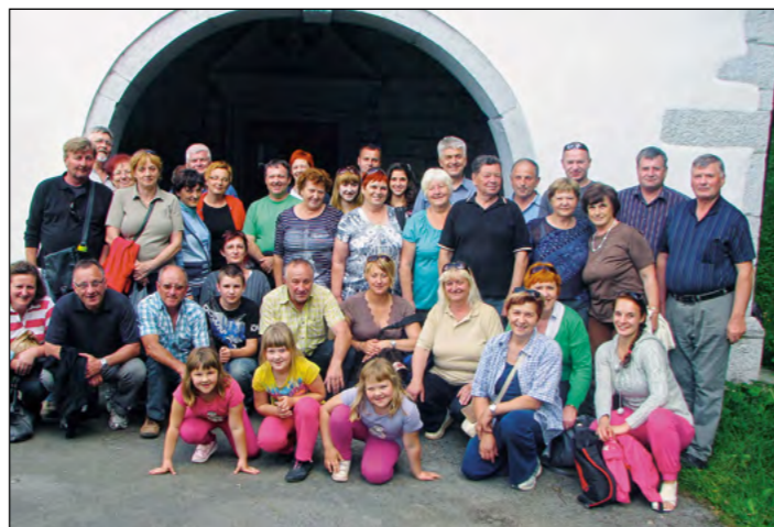
Pred cerkvijo sv. Jakoba v Narinu