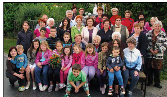
Šmarnice so bile tudi letos dobro obiskane.