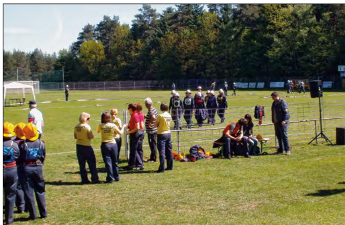
Številne tekmovalne ekipe so napolnile prostor lepo urejenega športnega parka v Gerečji vasi.

Na praznični petek, 27. aprila, so člani PGD Gerečja vas organizirali že VIII. gasilsko tekmovanje, ki je potekalo v lepo urejenem športnem parku v Gerečji vasi. Letošnjega tekmovanja se je udeležilo kar 46 gasilskih ekip od blizu in daleč, domala iz vse Slovenije, poseben pečat je dogodku dalo tudi lepo vreme, pa tudi organizacijsko je tekmovanje potekalo na zavidljivem nivoju.