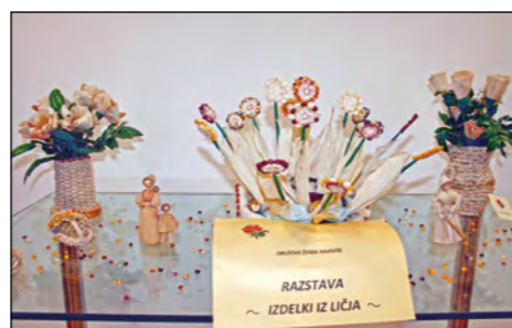
Razstava iz ličja je kar vabila k ogledu ...