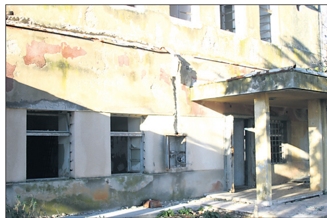
Tudi objekt, v katerem je bil oddelek 102, namenjen problematičnim zapornikom, je v popolnem razsulu. Za tem oddelkom je bila bolnišnica in šola, kjer so se lahko kaznjenci izučili za različna dela.