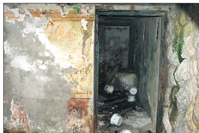
Vhod v eno od samih