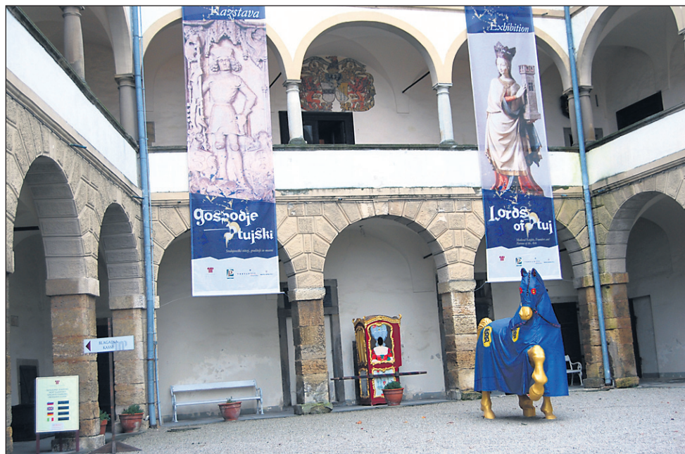
Zbirke na ptujskem gradu je v preteklem letu obiskalo 44.096 gostov.

V nekaj stavkih se je Arih dotaknil tudi investicijskih projektov, ki jih želijo realizirati v naslednjih letih. Kot je pojasnil, problem iskanja najemnika za grajsko restavracijo ostaja nerešen. »Terme se umikajo in kavarna ostaja zaprta. Inten-