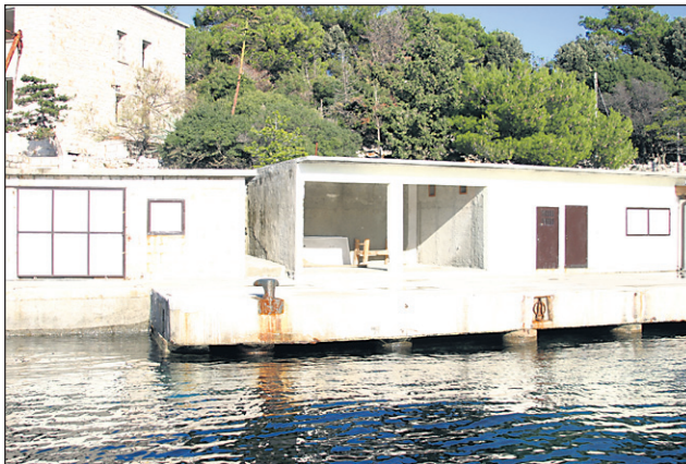
Glavno otoško pristanišče

nepojmljivih fizičnih in psihičnih pritiskov, kjer je prebil dve leti in pol. Na Goli otok je bil obsojen zaradi neke svoje izjave na fakulteti.