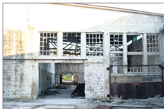
Opustošeni in uničeni so tudi vsi nekdanji industrijski obrati na otoku, ki so jih zgradili že v času informbiroja, ki so v funkcijo prešli kasneje.