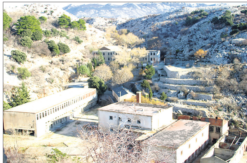
Taborišče Žica, kjer je bil tudi kino; med gledanjem filmov, ki so sledili po napornem delu s kamnjem, niso smeli zaspati.