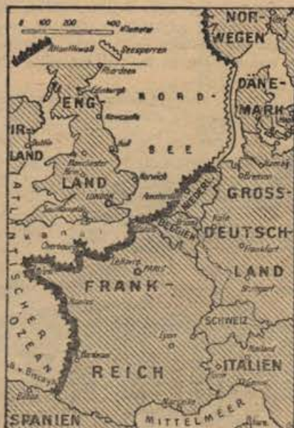
Der Westwall Europas

Iz poročil, ki jih je dobil DNB iz Pariza, je razvidno, da stoji ves francoski tisk v znamenju invazije. Francoski tisk objavlja tudi vse posameznosti operacij. Listi prinašajo opis bojev na prvih straneh, povdarjajoč pomen operacij in prve obrambne uspehe. Zemljevidi prikazujejo čitateljem bojišče. Listi povdarjajo, da je Francija zopet bojišče. Obenem prinašajo listi pozive maršala Petaina in ministrskega predsednika Laval. Oba pozivata narod k miru in treznosti. Tako so zakročili v francoskem tisku sliko epohalnega dogodka. Listi komentirajo invazijo v tem smislu, da so se morali Anglo-Amerikanci na pritisk Moskve podati v svojo pustolovščino. Sedaj so se znašli v težkih bojih, polnih izgub, ki jih je nemško vodstvo pripravilo v vseh posameznostih. Nemška vojska — tako pravijo francoski listi — brani ob francoski obali Reich in Evropo. V vseh listih se izraža zapanje v udarno silo nemške vojske tudi z ozirom na nadaljnja izkrcavanja na drugih obalnih pasovih.