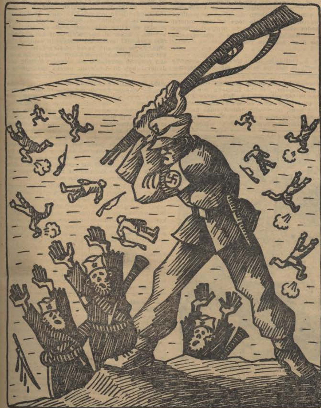
Boj boljševiški drhali!

□ Arterioskleroza Velike Britanije. Kakor ugotavlja list »Daily Mail«, pada delež mladine spričo angleškega skupnega prebivalstva vedno bolj in bolj, in sicer od l. 1937. Leta 1937 so v Angliji našli še 3.250.000 mladeničev in deklet med 14. in 18. letom. Danes jih je samo še 2 mil. 750 tisoč.