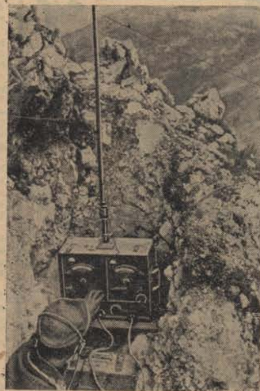
Im italienischen Kampfraum

Kakor Švici, tako vojna tudi Švedski ni prizanesla na gospodarskem področju. Njena gospodarska povezanost z vojskujočimi se silami, se je