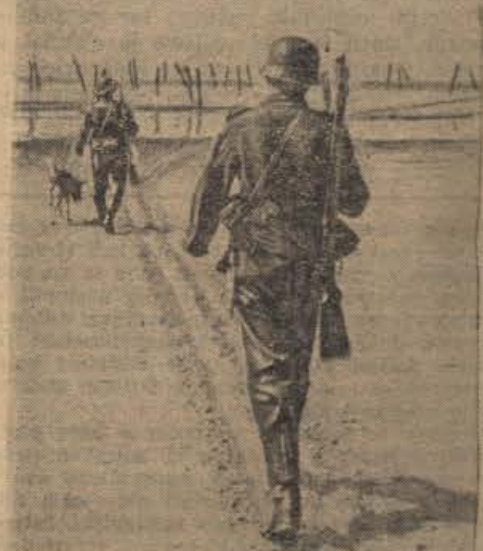
Doppelposten am Atlantikwall

Zelo opasen je mesec junij tudi človeškemu zdravju — kakor je sicer v normalnih vremenskih razmerah še posebno junij dobrodošel našemu zdravju in prerojenju. Opasen pa zamore biti zaradi hitrih vremenskih sprememb, kar velja zlasti glede toplote. Ne posedajmo na vlažna tla, če nam ni to neizogibno potrebno. Le ob zanesljivo sončnih dne si že ta mesec lahko privoščimo kopelji na prostem v tekoči vodi. Sicer pa letošnji junij sam skrbi, da nanj ne pozabimo. P.