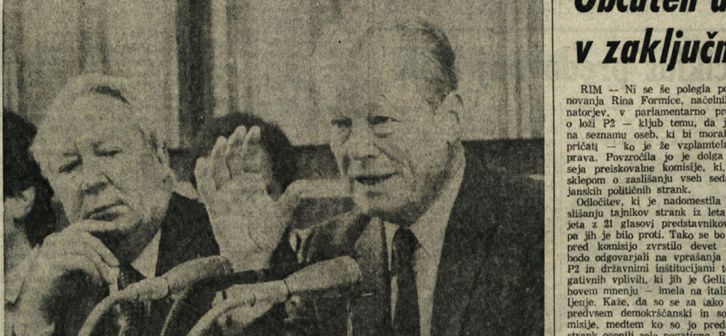
Willy Brandt in bivši britanski premier Edward Heath sta včeraj predstavila novo poročilo Brandtove komisije o «Splošni krizi» (Članek o vsebini in ciljih novega poročila objavljamo na zadnji strani)