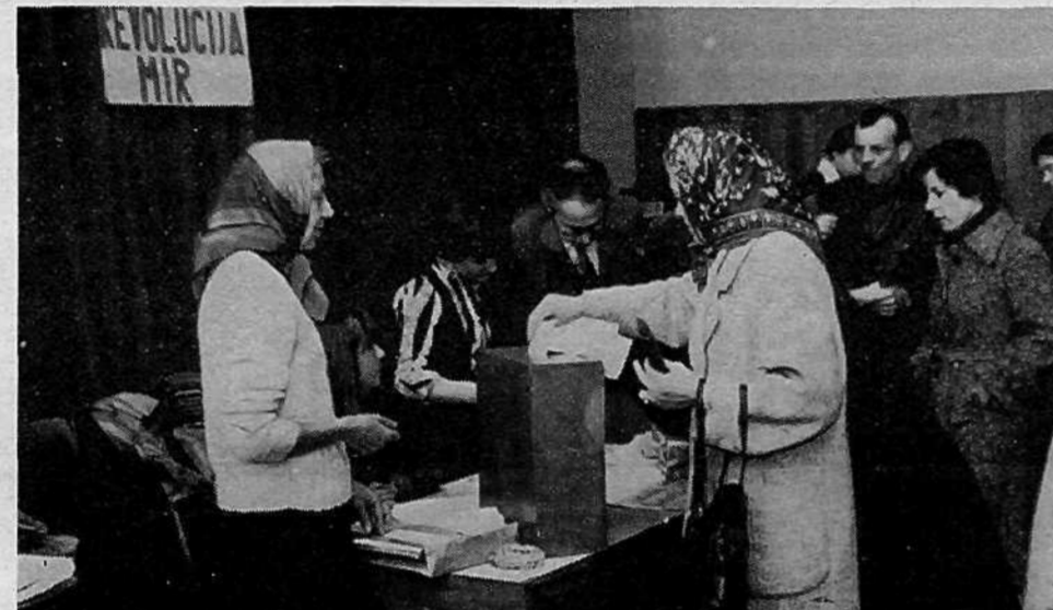
KS PRULE, VOLIŠČE 21 – vpisanih 1059 volivcev. Za vse SIS so volili posebne delegacije.

Priprave na volitve so bile pravočasne in obsežne. Delo delegatov sem spremljal, odločitev za splošne delegacije pa je nedvomno zelo dobra, saj bomo imeli za delegate boljše stike, kar zagotavlja obojestransko boljše obveščeno.