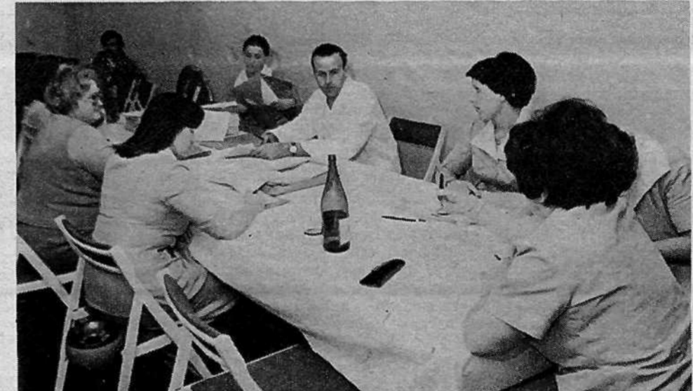
KLINIČNI CENTER, TOZD KIRURŠKA SLUŽBA – na 13 voliščih je bilo vpisanih 1150 volivcev. Za vse SIS so volili posebne delegacije. Volili so še v delavski svet TOZD in centralni delavski svet, komisijo za samoupravno delavsko kontrolo in disciplinsko komisijo.