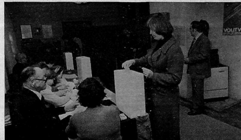
KS STARA LJUBLJANA, VOLIŠČE 11 – vpisanih 723 volivcev, ki so volili eno združeno za otroško varstvo, socialno skrbstvo, invalidsko-pokojninsko zavarovanje in zaposlovanje) in šest posebnih delegacij za skupščine SIS.

Trudila se bom, da bom resnično zastopala interese naših krajanov.