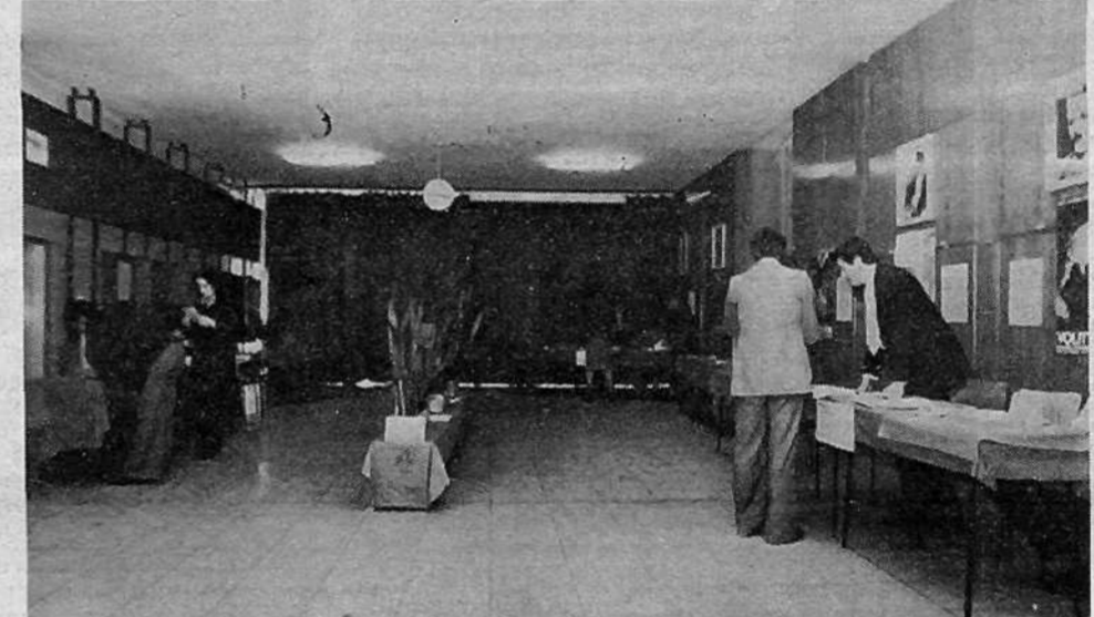
KS STARI VODMAT, VOLIŠČE 23 – vpisanih 1384 volivcev. Volili so posebne delegacije za vse SIS.