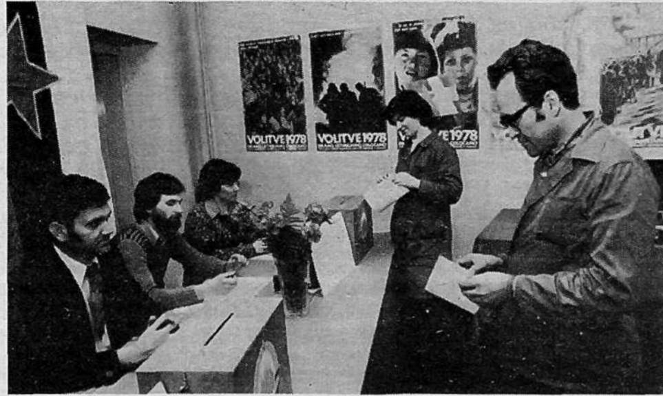
DO TOVARNA BATERIJ ZMAJ – 327 vpisanih volivcev. Posebne delegacije so volili za raziskovanje, stanovanjsko gospodarstvo in zdravstvo; združeno za zaposlovanje, invalidsko-pokojninsko zavarovanje, otroško varstvo in socialno skrbstvo; združeno za vzgojo in izobraževanje, kulturo in telesno kulturo.

Za združeno delegacijo smo se odločili zaradi sorodnosti področij. Naša naloga bo tudi pomagati starejšim občanom, pri čemer bomo še posebno pozornost namenili borcem. V delegacijo smo predlagali delegate, ki jih poznamo in vemo, da bodo delali.