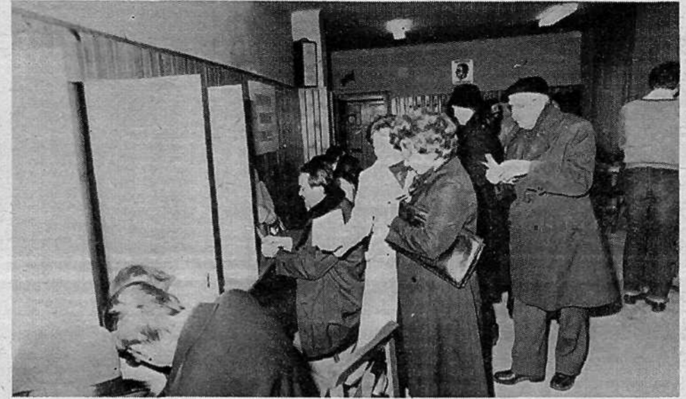
KS GRADIŠČE, VOLIŠČE 5 – vpisanih 1216 volivcev. Združeno delegacijo so volili za invalidsko-pokojninsko zavarovanje in zaposlovanje, za druge SIS so volili posebne delegacije.