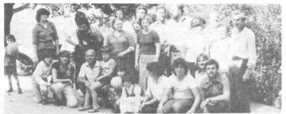
Udeleženci očiščevalne akcije 14. in 15. maja v Pacugu

Na Igu, pa tudi v drugih krajih, pa bi veljalo za v prihodnje razmisliti tudi o zbiranju drugih uporabnih odpadnih surovin, ki jih je kar precej po vaseh. Morda bi bilo bolje, da bi ta sredstva dobili osmošolci, kot pa da gredo v žepo posameznikov, ki pobirajo po vaseh dragocene surovine.