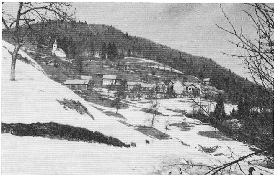
Vas Čabrače pod Blegošem