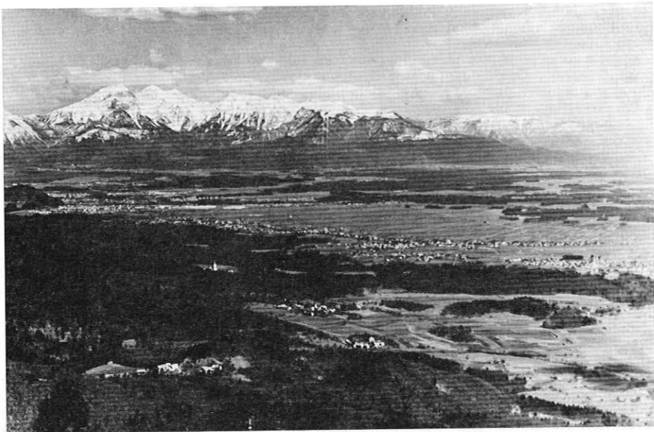
Sorško polje in Kamniške planine z Lubnika nad Škofjo Loko