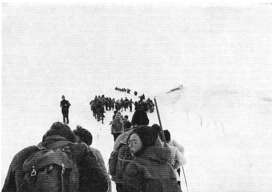
Kolona na Snežniku