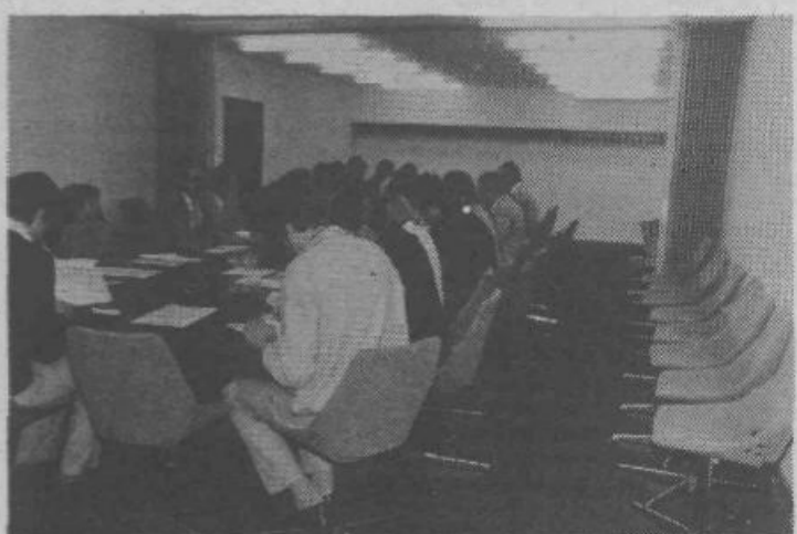
Manjšo dvorano v kleti že uporabljajo različne organizacije za svoje seje

soba za intenzivni študij (23 m 2 ) s 4 sedeži, ki si jih bodo lahko rezervirali člani knjižnice