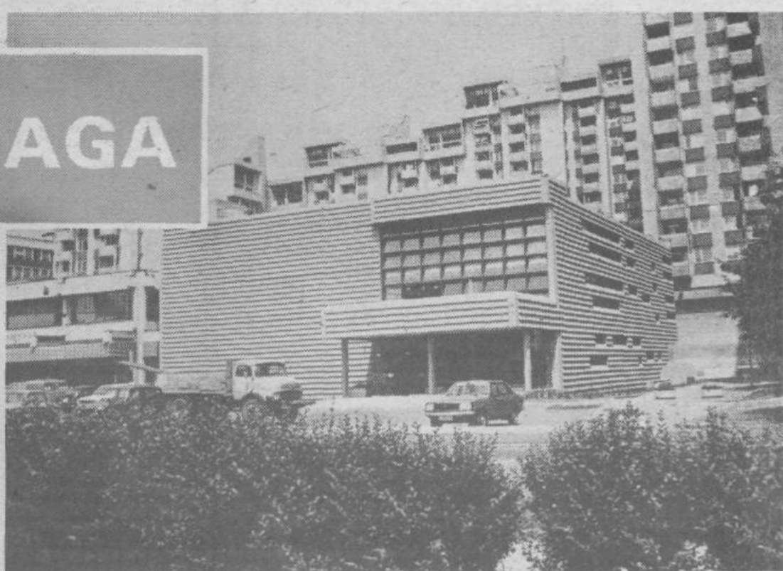
Sredi betona in zelenja je zrasel novi kulturni dom Španski borci

menovali po španskih borcih in naj bi bil njihov spomenik. Ideja je bila sprejeta, dom smo gradili kot domicilni objekt španskih borcev Jugoslavije in je kot tak prišel v republiški program gradnje spomenikov. Prav zato zakon o prepovedi neproizvodnih investicij leta 1980 ni zaustavil gradnje, ki je bila že tedaj v 3. fazi.