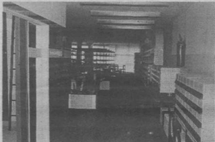
Katalogi, bralnica in knjižne police v 1. nadstropju že čakajo. Takoj po odprtju doma bodo bralci lahko potekali svoje najrazličnejše želje v novih prostorih knjižnice Jožeta Mazovca

Množično ljudsko zborovanje v soboto, 4. julija naj še enkrat potrdi Cankarjevo misel, da je boj za osvoboditev ljudstva kulturni boj. V novem kulturnem domu bodo namreč lahko zaživele samoupravljavci na vsej široki fronti organiziranih socialističnih sil, povezujoč boj revolucionarnih množic že pred 2. svetovno vojno z narodnoosvobodilnim bojem in revolucijo jugoslovanskih narodov in narodnosti, z bojem za svobodno, ustvarjalno osebnost slehernega od nas. Bodo lahko — kajti v tem delu Ljubljane z bogato revolucionarno in kulturno, posebno ljubiteljsko dejavnostjo bo to zgolj nadaljevanje pri še hitrejši rasti kulturne ustvarjalnosti in poustvarjalnosti krajanov Most, občanov naše občine in mesta Ljubljane.