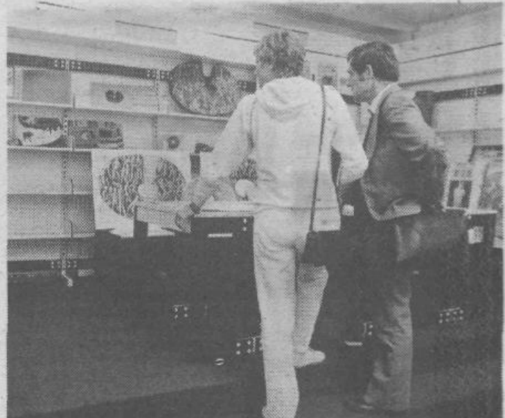
Razstavljeni osnutki spominskega obeležja