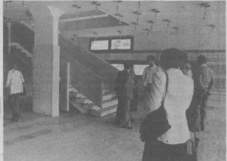
Prostorna veža bo omogočala ne samo hiter pretok obiskovalcev doma, marveč najmanj tudi različne razstave, manjše prireditve ipd.

Množično ljudsko zborovanje v soboto, 4. julija naj še enkrat potrdi Cankarjevo misel, da je boj za osvoboditev ljudstva kulturni boj. V novem kulturnem domu bodo namreč lahko zaživele samoupravljavci na vsej široki fronti organiziranih socialističnih sil, povezujoč boj revolucionarnih množic že pred 2. svetovno vojno z narodnoosvobodilnim bojem in revolucijo jugoslovanskih narodov in narodnosti, z bojem za svobodno, ustvarjalno osebnost slehernega od nas. Bodo lahko — kajti v tem delu Ljubljane z bogato revolucionarno in kulturno, posebno ljubiteljsko dejavnostjo bo to zgolj nadaljevanje pri še hitrejši rasti kulturne ustvarjalnosti in poustvarjalnosti krajanov Most, občanov naše občine in mesta Ljubljane.