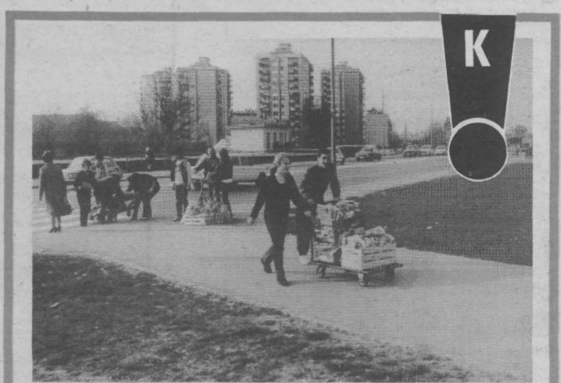
Pionirji in mladinci Štepanjskega naselja redno zbirajo star papir. Največkrat je to humanitarna akcija za Rdeči križ. V tem primeru pa so mladinci zavijali rokave in zbirali star papir za končni izlet. Tudi prav in obojestransko koristno.

Časopis prejemajo vse družine v občini brezplačno na domove.