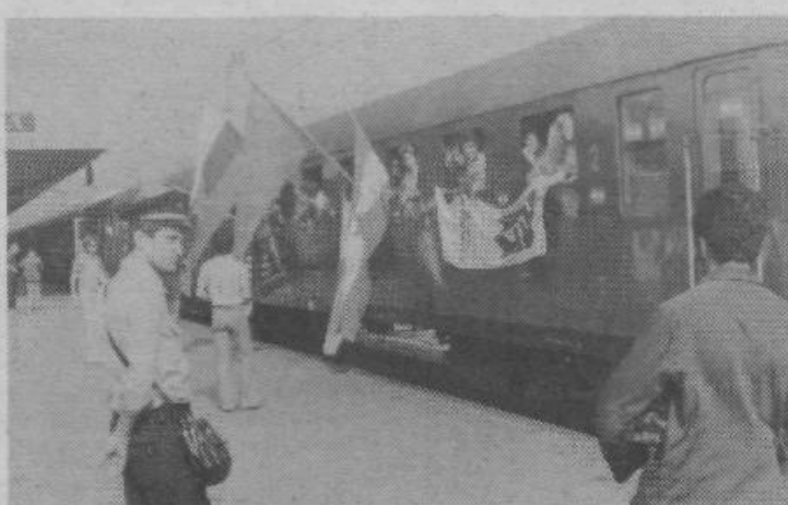
1. junija je odšla na delo naša prva brigada, in sicer v Kostanjevico pri Novi Gorici. Mladi bodo gradili vodovod, po programu sodeč pa bo dobršen del časa posvečen tudi izobraževanju. Delovna akcija naj bi zares postala šola samoupravljanja.