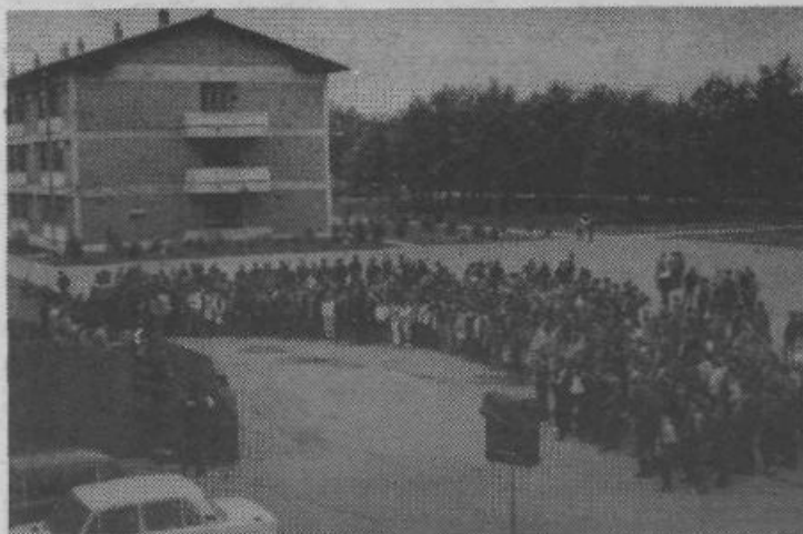
»Druže Tito, mi ti se kunemo...« je bila prav gotovo pesem, ki jo je bilo te dni najpogosteje slišati. Iz več kot sedemsto grl je donela ta zaobljuba tudi v vojašnici Bratstva in enotnosti, kjer je bil letošnji osrednji sprejem v ZSMS. Po krajšem kulturnem sporedu so si novi mladinci ogledali orožje, s katerim razpolaga naša armada.