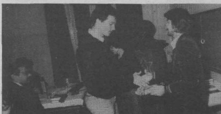
Večje število mladih je bilo na ta dan sprejetih v zvezo komunistov. Posnetek je z gimnazije Moste, kjer so se vrste komunistov povečale za devet članov.