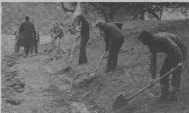
Številne zabavne prireditve, športni turnirji, delovne akcije so potekale ob dnevu mladosti. V SAP — Viator so mladinci pripravili razstavo, posvečeno tovarišu Titu, v OŠ Polje je bilo 3. srečanje mladih tehnikov Ljubljane in nekaterih krajevnih skupnosti pa so se mladi pomerili v več športnih panogah. Prav na dan mladosti so brigadirji naših prvih dveh brigad KRAS in ISTRA delali na delovišču Poti spominov in tovarštva.