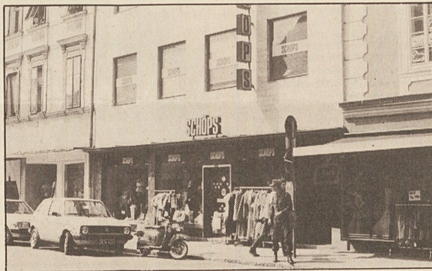
Je tudi Schöpsova trgovina v Celovcu zastražena?

iskati storilce. Na Dunaju pa so si ti krogi znova izbrali Schöpsovo trgovino in nastavili bombo. Bila je prav tako „primitivna“ kot salzburška in tudi tu so uporabljali črni smodnik. Ta zadnja vrsta neonacističnih zločinov je iztrgala jav-