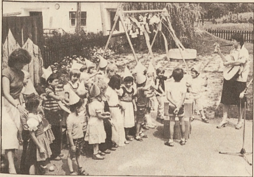
Veselite je bilo veliko ...

vrtca, je takole ocenila delo vrtca: „To je ena najbolj pozitivnih ustanov Koroške. Tu se otroci že v zgodnji mladosti vzgajajo v duhu strpnosti in pravega dojemanja narodnosti. Prireditev, ki je bila odlična, je pokazala, da se budi v otrocih kreativnost, da se vzgajajo v duhu skupnosti in samostojnosti in dobijo čut pravega tovarištva. To jim bo ostalo vse življenje. Pomembno pa je tudi, da so danes starši sodelovali. O vrtnaricah pa bi samo dejala, da je njima poklic tudi poslanstvo, saj se zavzemata za vsakega posameznega otroka in to pove vse.“