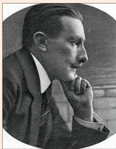
Anton V. Codelli, plemič, politik, veleposestnik in izumitelj