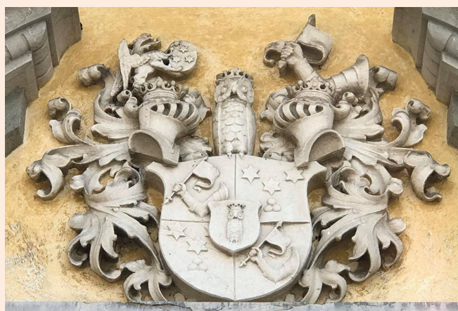
Codellijev grb na monumentalni grobnici v Štepanji vasi pri Ljubljani