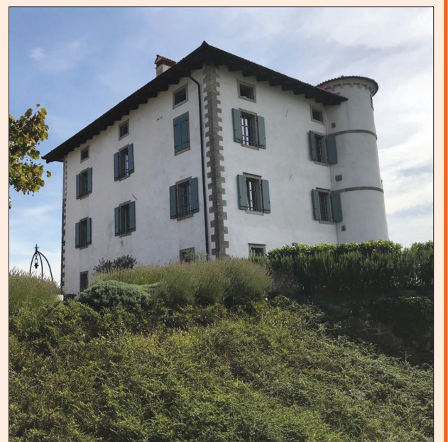
Codellijev grad na Ceglem v Goriških Brdih, poznan tudi kot "Gradič" oz. "Gredič"