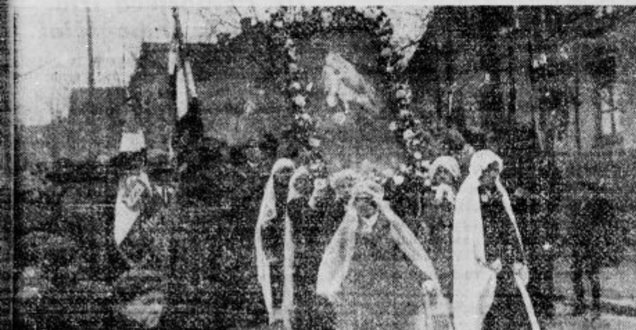
Brezje imajo tudi Slovenci v Franciji in sicer v Merlenbachu. Tam je bila te dni procesija, v kateri so nosili lastno podobo Matere božje na Brezjah. Slovencev ne bo konec, ako bodo povsod po svetu, kamor jih je vrgla usoda, iskali varstva Marije Pomagalj.