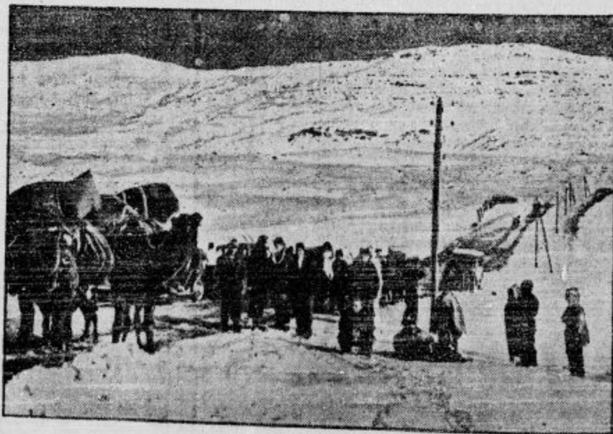
Kamela je ladja v puščavi. Ampak to pot dvo- in enogربی živalici huda prede. Zapadel je namred sneg, ki vročine navajenemu velblodu ni dobrodošel. Naj potrpi, saj je danes na svetu itak vsi narobe.