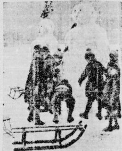
Sneženega moža delajo. Samo pazijo naj, da jim sneženi mož ne napiše »čevkov« v polletne izkaze.