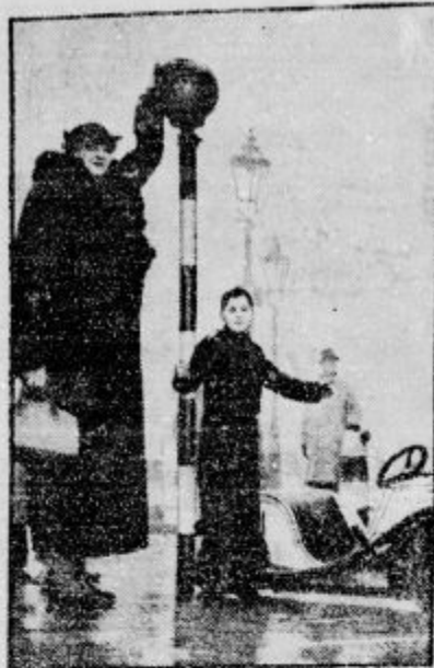
Najvišja angleška žena. Se pred ma hno ima mašičko kdo respekt, kaj seje pred tole! Bogve, ali je v njenih prsih tudi veliko plemenito srce...

Vsaka pomč je bila brezuspšna. Obtoženec se je zagovarjal s silobranom, zatrjujoč, da ga je kuhar sam napadel in podrl na tla. Kuhar je bil drugače miren in trezen fant in je hotel le mirati. Maks Baloh je bil obsjejen na dve leti in šest mesecev robije. — Ne z nožen, ampak z uma svetlim mečem se bore — izobraženi fantje.