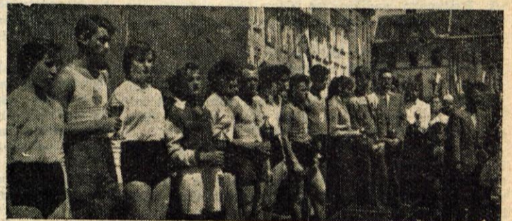
Najboljši v tekmovaljih na Dan mladosti so prejeli pokale