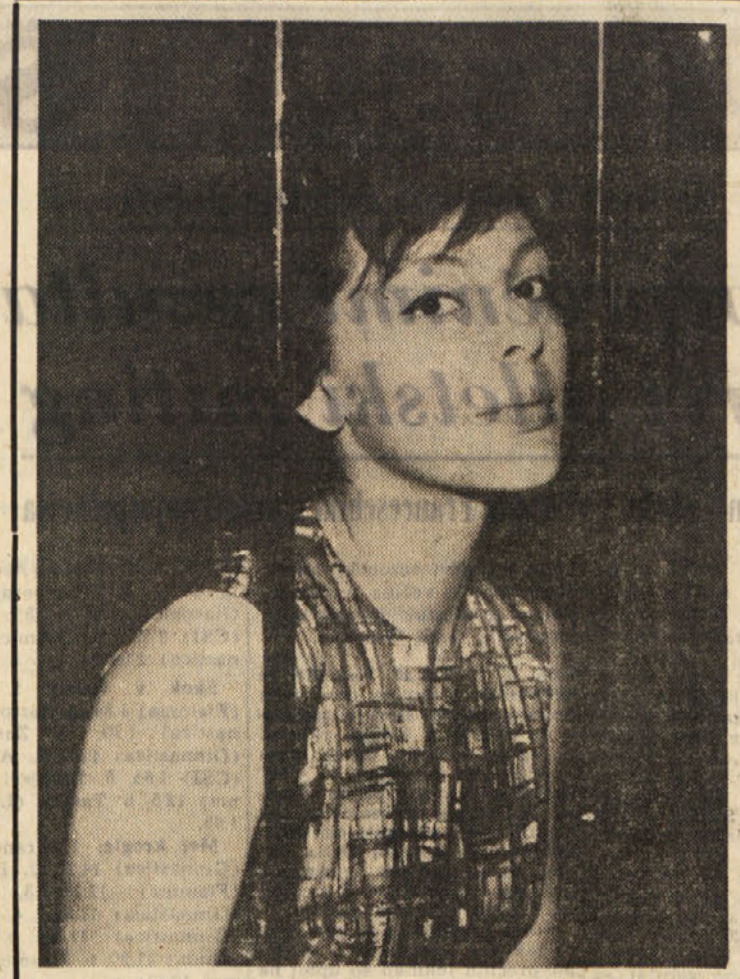
Françoise Prevost, ki je z Vallonejem igrala v filmu «Vojskav počitka je najresnejši kandidat za glavno vlogo v filmu «Morje, ki ga dela Griffith

OVEN (od 21. 3. do 20. 4.) Spoprijeli se boste s poslovni in nasprotniki, pri čemer morate biti previdni. Veselite se zadostne družini. BOBK (od 21. 4. do 20. 5.) Učinkovita prilika tudi za dokaj tvegane posle. Krajša ločitev bo samo poglabila neko ljubezen. Zdravje odlično. DVOJČKA (od 21. 5. do 22. 6.) Se boste v nekem poslu nekoliko popustili, se boste ognili do najkrajšim kompromisom. V družini zadovoljivo z otroki. RAK (od 23. 6. do 22. 7.) Ne zaustavite se že pri prvih težavah, končni uspeh vam je zagotovljen. Ne kažite prevelike občutljivosti. LEV (od 23. 7. do 22. 8.) Sreča je na vaši strani, neki spor,