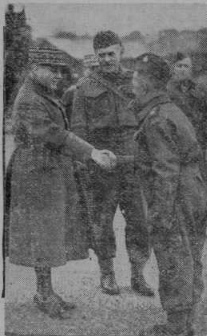
Francoski general Gamelin, poveljnik zavezniških čet na zapadu, pozdravlja poveljnika na bojišču dospevih kanadskih čet

Omenjeno napeljavo imenujejo Angleži »Pipe Line« in pričenja v Kerkuku, gre v južozapadni smeri preko srednjeazijske reke Tigris do reke Evfrat. V severozapadnem Iraku pri Hadithi se