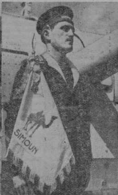
V vojni dežujejo junška dejanja in odlikovanja. Slika nam predstavlja nekega francoskega mornarja z odlikovanjem