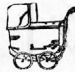
troški vozički najnovejših modelov

KLISČEJE VSEH VRST IZDELUJE KLISARNA LJUBLJANA, DALMATINOVA 15 ST. IDEU