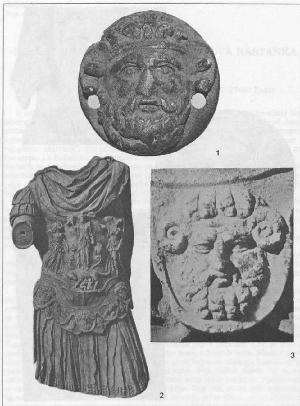
T. 1: 1 Adlešiči. Bronasta pteriga z upodobitvijo Jupitra-Amona. 2 Atene. Kip cesarja Hadrijana. 3 Atene. Pteriga z Jupitrom-Amonom na kipu cesarja Hadrijana.