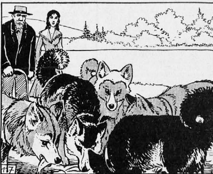
197. Ves ta čas Baree ni srečal pripadnikov svojega plemena. Pierrotovi psi so namreč čez poletje živeli na tri milje oddaljenem otoku sredi samotnega jezera in jih je hodil krmit dvakrat na teden. Jeseni sta ga na tej poti spremljala tudi Nepeesa in Baree. Pierrot je zadovoljno ugotovil, da se je Baree takoj sprijaznil s psi.