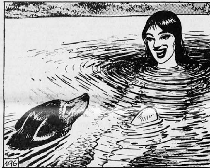
196. Poletje je prineslo Nepeesi in Bareeju čudovite dneve. Baree se je počasi privadil tudi Pierrota, toda njegov edini gospodar je bila Nepeesa. Samo zanjo je živel in jo je spremljal na vsakem koraku. Najraje sta hodila k jezeru in se skupaj kopala. Ob Nepeesi je Baree še vode ni bal. Pierrot je zadovoljno opazoval njegovo zvestobo.