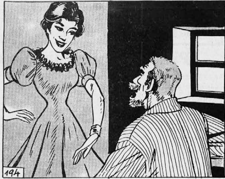
194. Tudi ona je tri leta preživela v mestu in se je v šoli mars kaj naučila. Znala je šivati in zato se je sama lotila dela. Tri dni je marljivo šivala in za rojstni dan je bila nova obleka sešita. Za ta praznik si je zvala lase v bogate kodre okrog glave, zataknila vanje cvetočo vejico in se vsa ponosna pokazala očetu v novi obleki.