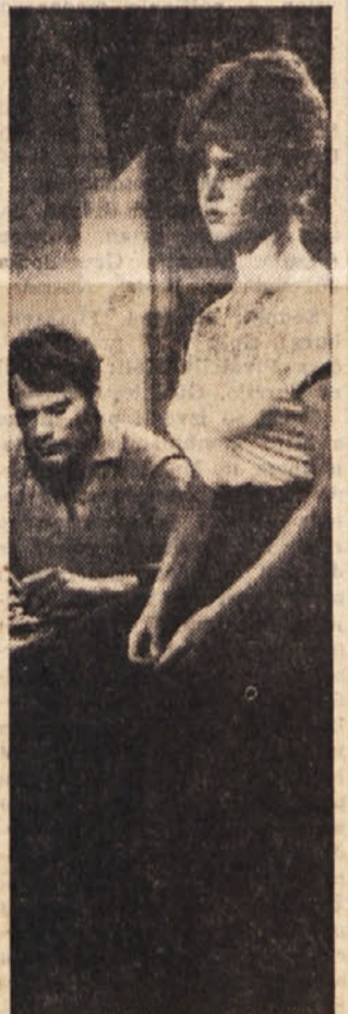
Brigitte Bardot v filmu «Le Diable à cinq»