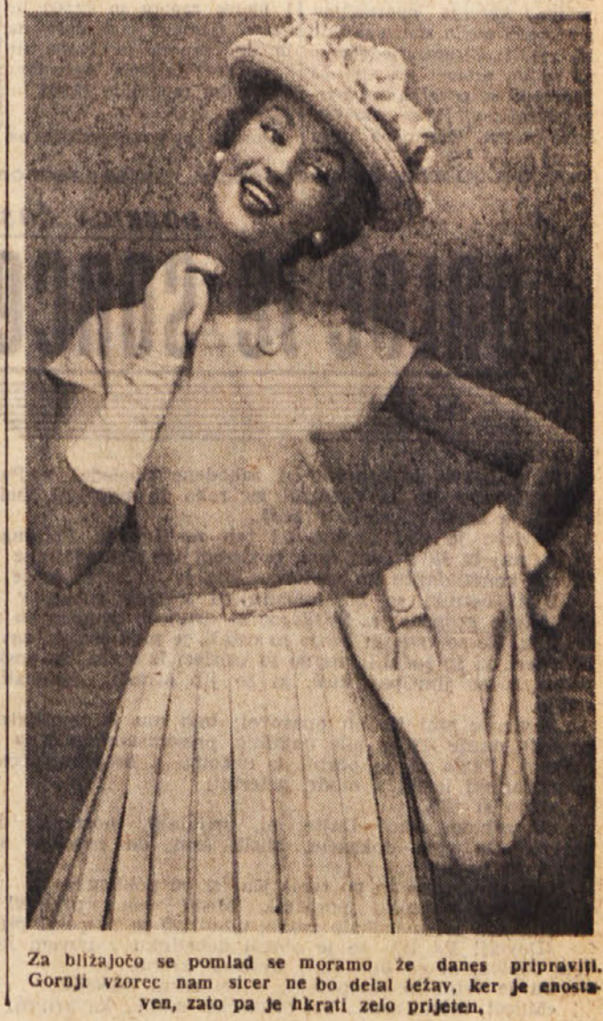
Za bližajočo se pomlad se moramo že danes pripraviti. Gornji vzorec nam sicer ne bo delal težav, ker je anostaven, zato pa je hkrati zelo prijeten.

Nove tkanine epuhastega popelinas so uporabne predvsem za široke obleke, prav tako pa tudi za drapirane. Vse kaže, da se nam pri izbiri vzorcev ne bo treba pritoževati nad muhavostjo mode, čeprav je ta pritožila na dan tudi nekaj nelepimi zamisi. Vzorcji z zgrešeno Petrekovo nalogo, vse mogočimi geometričnimi liki, pismi, knjigami itd. pa bodo šli le mimo nas in se jih bomo spomnili le kot — hipno modno posebnost. SILVIJA