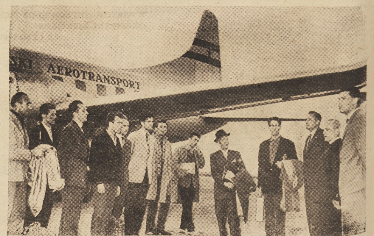
Sprejem Poljakov na Zagrebškem letališču

»Vprašali ste me, kako smo sprejeli povabilo. Naj takoj odgovorim, da z velikim navdušenjem, zlasti še, ker je letošnja prireditve pohoda tako tesno povezana z zgodovinsko obletnico vaše ljudske vstaje. Ker smo imeli že med vojno skupni cilj, borbo proti okupatorju, smo se tudi sedaj radi odzvali na skupno športno tekmovalstvo v počastitev narodnoosvobodilne borbe.«