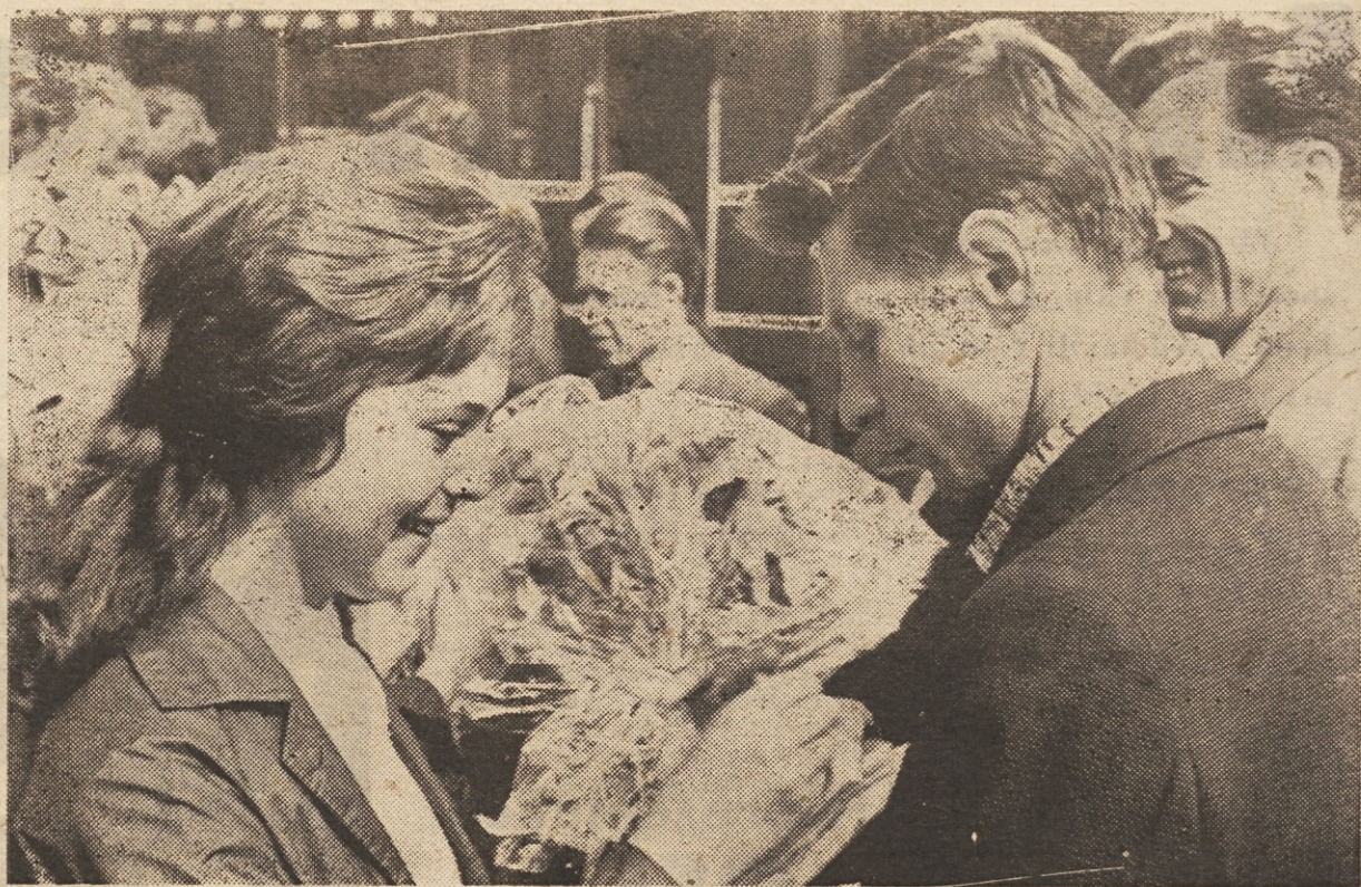
Sprejem tujih tekmovalcev