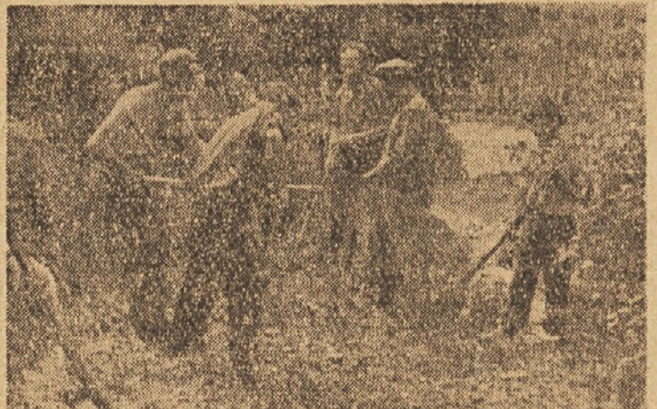
Vedrih in nasmejanih lic so delavci pričeli odstranjevati naplavine

Okrajni odbor Rdečega križa bo v sodelovanju z osnovnimi organizacijami Rdečega križa pomoči potrebnim še nadalje pomagal v okviru svojih možnosti. Te možnosti se odvisne predvsem od števila članstva Rdečega križa. Čim večje je število članstva tem močnejša je organizacija in tem lažje izpolnjuje svoje naloge. Zato naj bi ne bilo nobenega našega prebivalca, ki ne bi bil član Rdečega križa!