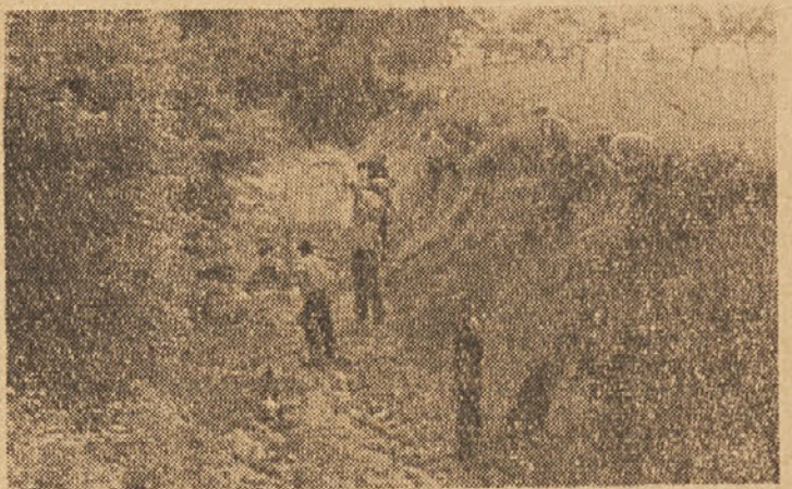
Delavci pri čiščenju občinske poti

V elektrarni Brestanica je plaz delno zasul premog, na več mestih je voda preplavila okoličino in zajela črpalnice, da je bilo delovanje črpalak onemogočeno. Prav tako je voda vdrila v stanovanjske kolonije na Gorici in povzročila občutno škodo. V tem podjetju cenijo preko 1 milijon dinarjev škode.