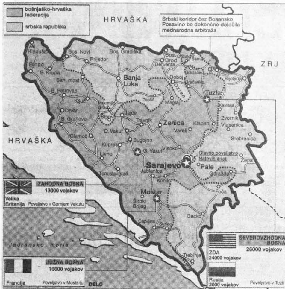
Razdelitev Bosne in Hercegovine, kakor so jo odločili Hrvati, Srbi in Bosanci ob podpisu mirovne pogodbe.