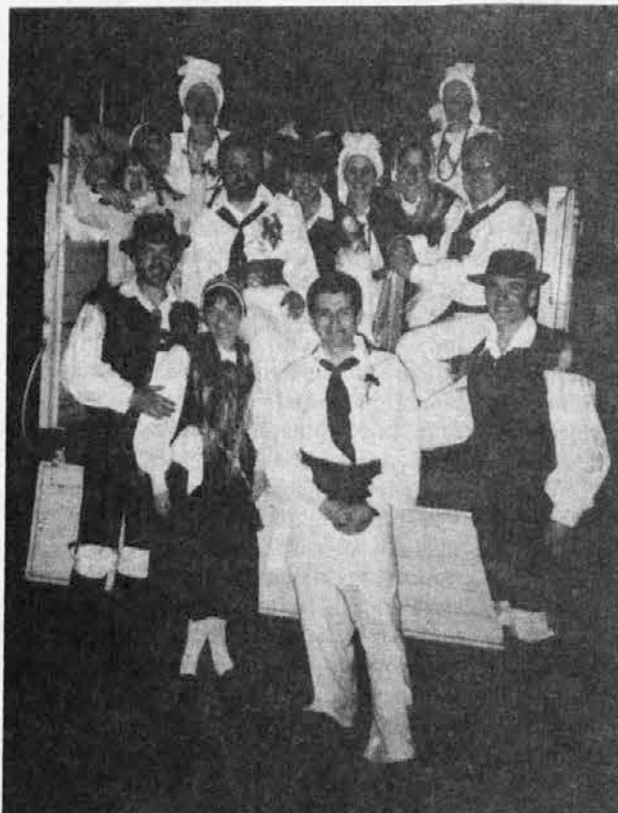
Karapačajska folklorna skupina „Maribor“

Poglavje zase pa posvetimo karapačajski folklorni skupini „Maribor“, ki se že dve leti predstavlja ter vlaga ogromno truda in časa, da bi bili vedno boljši. Predstavili smo se 13. avgusta na mladinskem dnevu v Karapačaju; 6. oktobra v šoli San Antonio