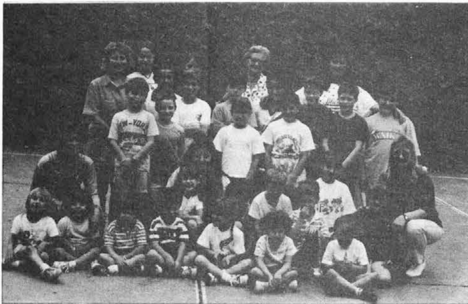
Zgoraj: Slovenska karapačajska šola Josipa Jurčiča. Spodaj: Odkritje plošče žrtvam druge svetovne vojne.