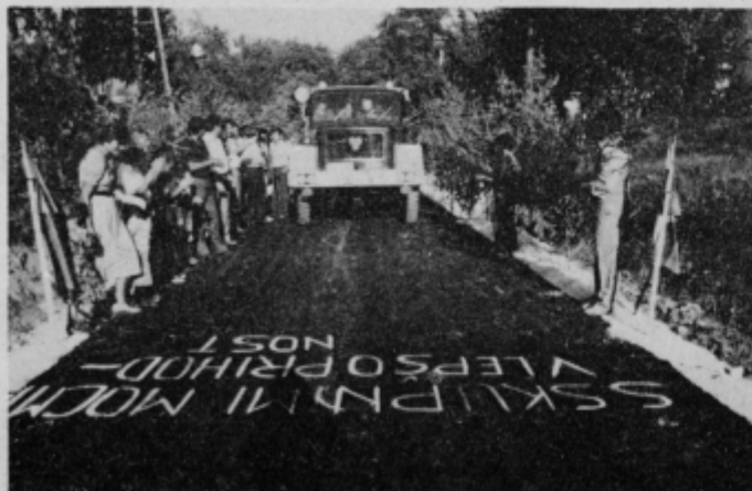
Asfaltno cesto na Zabljeku je „krstilo“ gasilsko vozilo PGD Videž, njegovi člani so prav tako veliko prispevali pri pripravi cestišča za asfaltiranje.

V Zabljeku so na osrednji svečanosti osvetlili trnovo pot, ki so jo morali prehoditi, da so prišli do asfalta. Cesta je zahtevala velika denarna sredstva in tudi lastno delo krajanov, na nerazvitem območju, pa to ni bilo ravno lahko. Z veliko mero dobre volje, zagnanosti, samoodpovedovanja in z delovnimi akcijami so ob prazniku krajevne skupnosti slavili po-