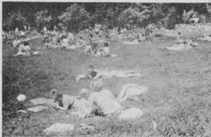
Prijeten odh od kopališču, saj bo morje s plažami marsikomu vse težje dostopno.