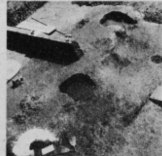
Latenske lončarske peči, vkopane v zemeljski obrambni nasip ormoške naselbine iz časa Kulture žarnih grobišč, odkrite leta 1979.