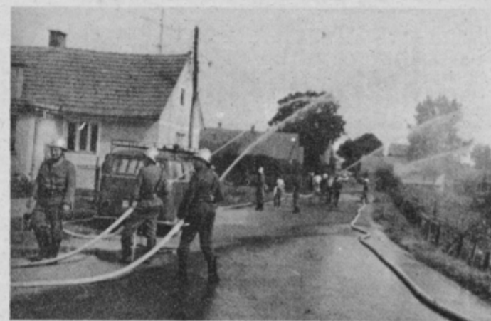
Pred slovesnostjo so gasilci izvedli veliko vajo, ki je odlično uspela.