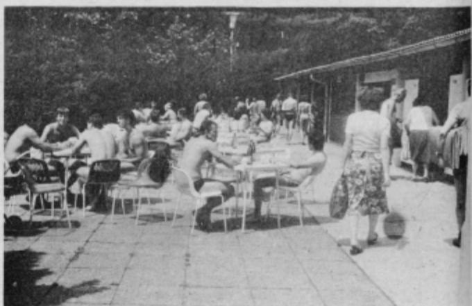
Ponudba v točilnici in na prostoru pred njo bi morala biti pestrejša.