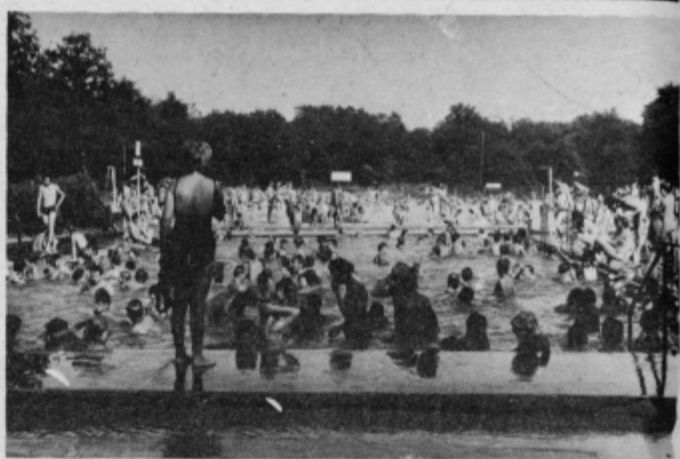
Takšni množici kopalcev je treba nuditi tudi druge oblike rekreacije in usluge.