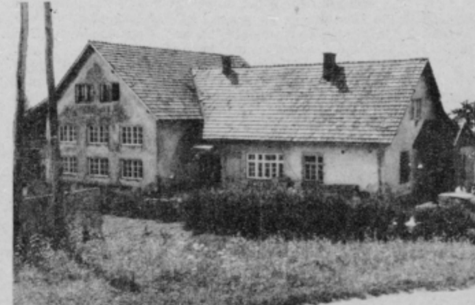
Tak pa pogled na objekt v katerem že domujeta pošta in vrtec, ki je začasno zaprt zaradi prevelikega števila otrok