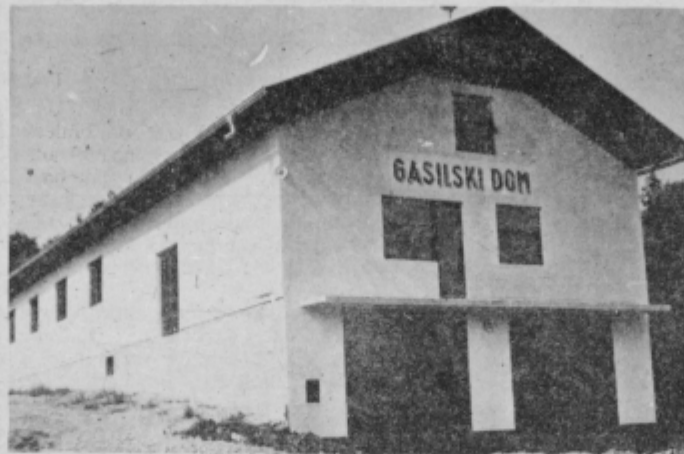
Gasilci iz Zamušanov so ponosni na novozgrajeni gasilski dom, ki sodi med največje v občini.

nedeljo popoldne člani GD Zamušani zbrali na slavnostni seji, osrednja slovesnost pa se je nekaj po 15. uri pričela z mimohodom gasilskih enot iz okolice. Po slavnostnem govoru so najzaslužnejšim gasilcem podelili priznanja.