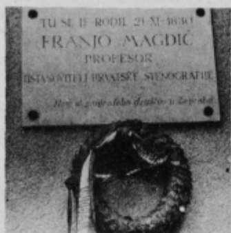
Spominska plošča, odkrita leta 1934.