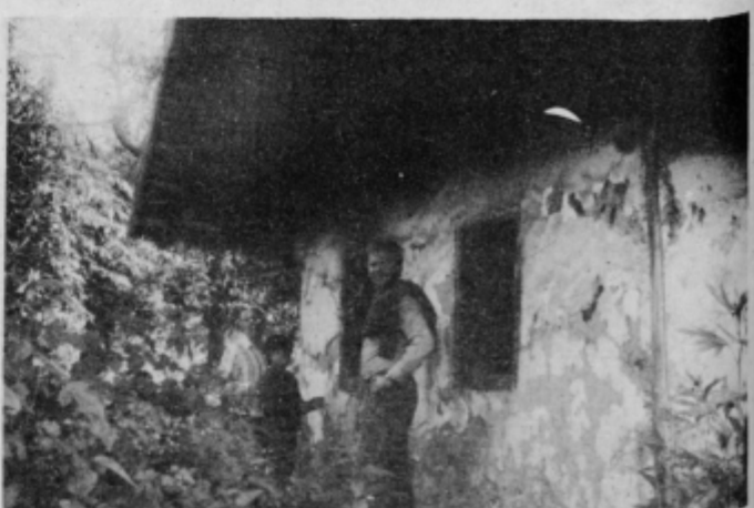
Če smo hoteli pogledati v to hišico, smo si morali utirati pod mokropirami, trnjem in grmičevjem.