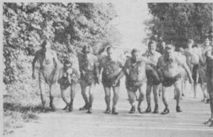
Trije suhci in štirje debeluhci pripravljene na sprint.