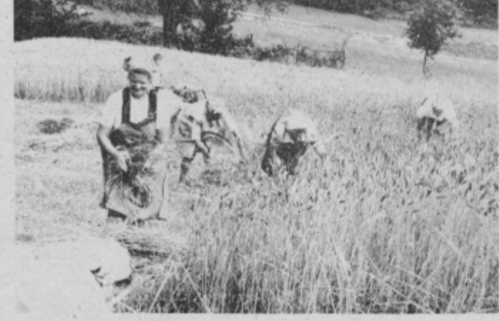
Šedem žanjic se je s srpi pognalo v žetev pšenice.