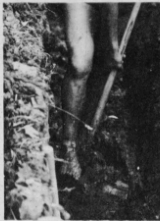
Vse globlje v blato in razmočeno zemljo...