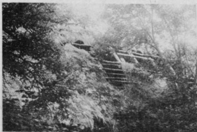
Pot, ki je nekoč peljala mimo te domačije je zarasla, da je sploh ni več moč videti.

Ljubiteljem narave pa priporočam, da ne le z avtomobili, tudi s kolesi se naj večkrat napotijo na izlet v naše podeželske kraje in uživali bodo ob lepem sončnem vremenu. Zlasti priporočam pot skozi Grajeno, Grajenščak, Drsteljo in prek Mestnega vrha in Rabelče vasi nazaj v Ptuj. Pa tudi več drugih, manj znanih, a nič manj slikovitih poti je, le potruditi se je treba. Besedilo in posnetki: Konrad Zorec