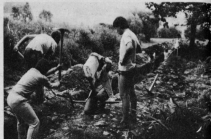
V poletni vročini je voda najbolj osvežujoča pijača.