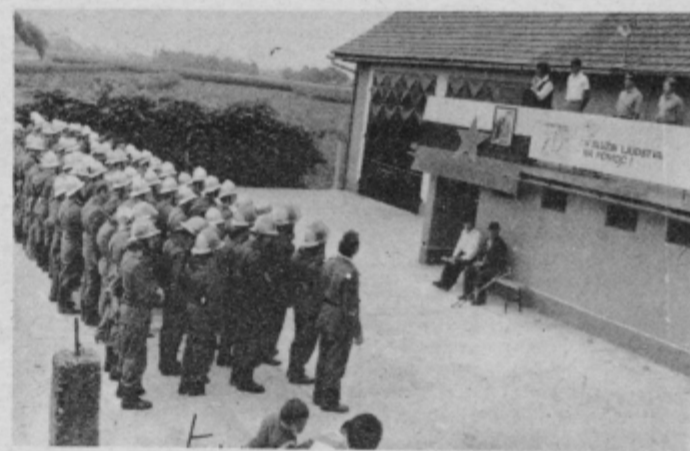
Zbrani gasilci in gostje pred prizidkom gasilskega doma hajdinskih gasilcev.