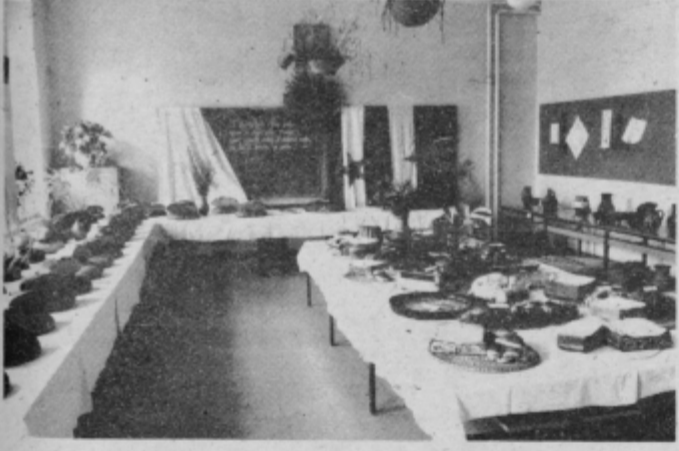
Lepo urejena razstava kruha in pogač.