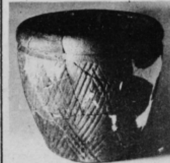
Keramični lonec iz 1. stol. pred n. št., odkrit v ormoški prazgodovinski naselbini