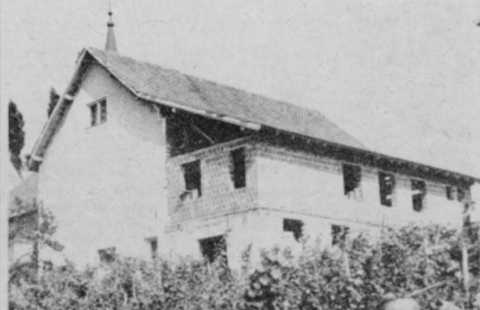
Prizidek k prosvetni dvorani v Destrniku je že pod streho.