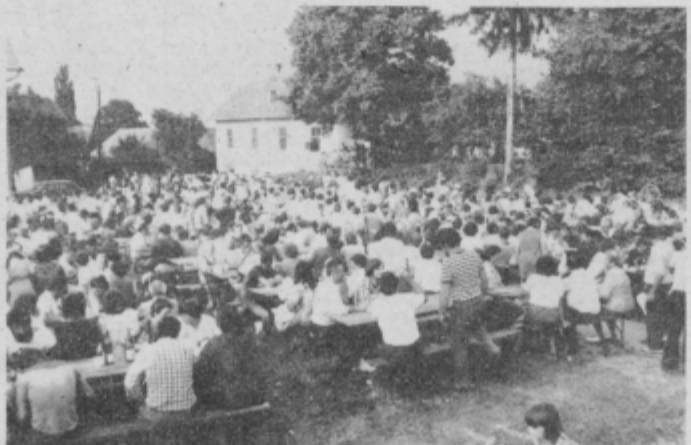
Številni gostje od blizu in daleč na veselilnem prostoru.