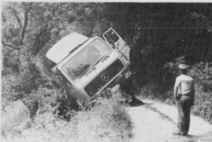
Tovornjak se je naslonil na drevo.

Ko so za nesrečo izvedeli miličniki, so odhiteli na ogled terena in začelo se je vsesplošno mobiliziranje. Na kraj nesreče so prihiteli gasilci, pa inšpektorji, predstavniki Agrottransporta in Civilne zaščite ter drugi. Ocenjevali so škodo, razglabljali o tem, kaj je potrebno storiti in kdo je za kakšno odločitev pristojen. Edini, ki si zaslužijo priznanje, so gasilci iz Ptuja, Zavrča in Stojnec, ki so brez odobritve občinske sanitarne inšpektorice Lundrove odstranili vse sode z njive in druge ostanke s pobočja. Pospravili so tudi vse, kar je ostalo na tovornjaku. Od gasilcev so za količine izlite solne kisline izvedeli tudi inšpektorji, ko so okrog osemnajste ure in trideset minut le-ti končali natovarjanje sodov na težko dostopnem področju. Izlilo se je 1100 do 1500 litrov kisline in manjša količina Jupola. O nadaljnji sanaciji inšpektorji še vedno niso dali navodil, saj je bil kemik iz VGP službeno odsoten na ekološkem sejmu v ZRN, predstavnika Zavoda za zdravstveno varstvo v Mariboru pa še ni bilo na kraj nesreče. Najbolj