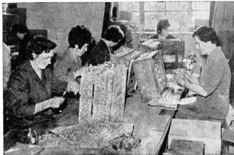
Zavijanje izdelkov v skladišču je postalo ozko grlo, vendar so pridne roke naših delavk to nadomestile. Pričakujemo nov stroj.