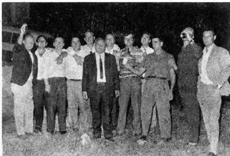
Tudi za šoferje mora biti trenutek počitka. (Na sliki skupina šoferjev in drugih ob praznovanju njihovega praznika.)