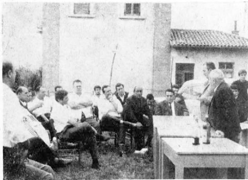
Soferji ob svojem prazniku na Maliji