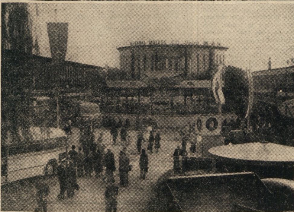
Pogled na inozemski del velesejma, kjer prevladujejo prvem stroji ter najmodernejši avtomobili. Angličani so prvi razstavili svoje najnovejšo avtomobile za mestni promet, ki imajo motorje pod šasijo. S podobnimi novostmi se ponašajo še zlasti Nemci in Francozi.