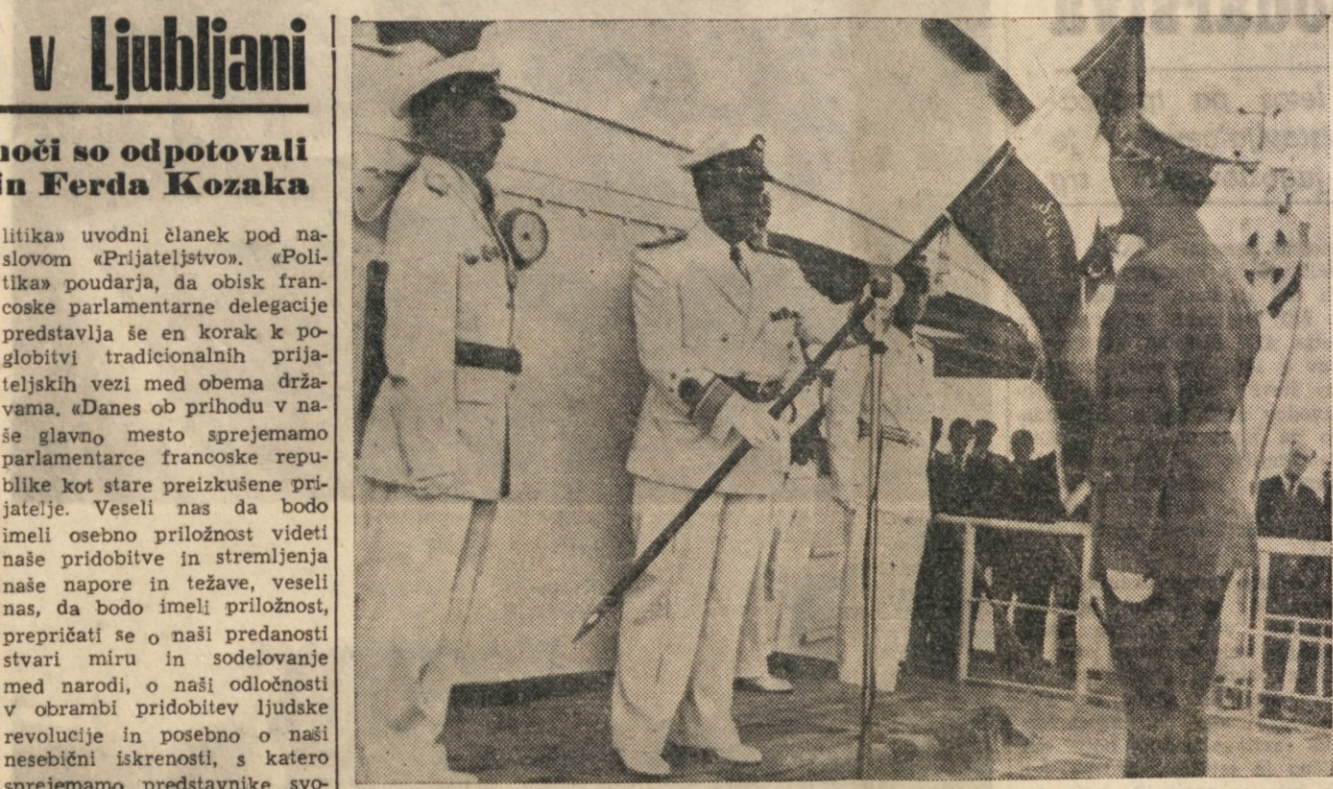
Ob desetletnici ustanovitve jugoslovanske mornarice je bila v Splitu slovesnost, na kateri je maršal Tito izročil mornarici nov praport

Uravno javljajo, da je bilo v koncentracijskem taborišču Pongandou pri incidentih preteko sredo ranjenih 23 tankajšnjih internirancev. Dva