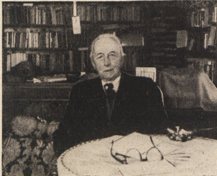
Dvainosemdesletni pisatelj v svoji delovni sobi