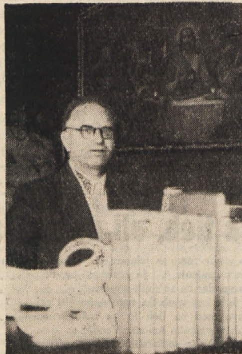
Tudi dekan bogoslovne fakultete dr. Cajnkarku neumorno piše

Zdi se mi, da je treba tu povedati predvsem, da prekinjeni razgovori z ozirom na to, da škofje za razgovore niso bili pooblaščen, ne