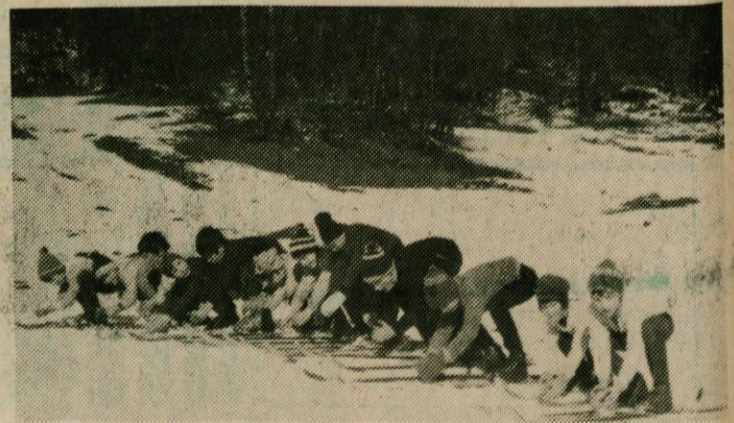
MLADI LOGAŠKI SMUČARJI NA TEČAJU NA ČRNEM VRHU NOVEMBRA 1974

Prijave sprejema vodstvo kluba ob sredah in sobotah zvečer v telovadnem domu.