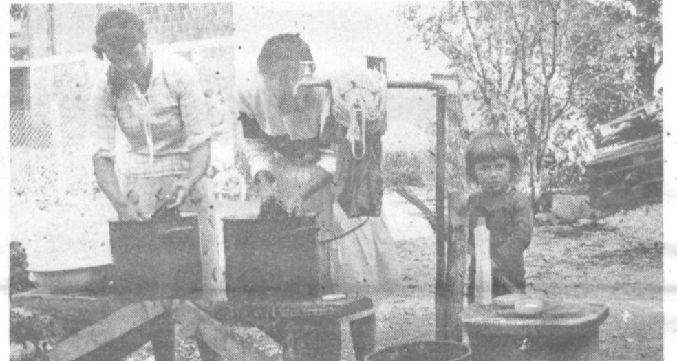
DO ČISTEGA PERILA V MRZLI VODI NA DVORIŠČU – Ni več veliko ljubljanskih domov, kjer je treba priti na roko na dvorišču, kjer je tudi edini vir vode. V visoki dvonadstropni hiši, eni od mnogih na Rakovi jelši, vodovoda namreč ni.

Krajanje vedo, da bodo morali marsikje prijeti za delo, vendar nimajo nič proti. V vseh teh letih obljub in dogovorov pa se je v krajevni skupnosti