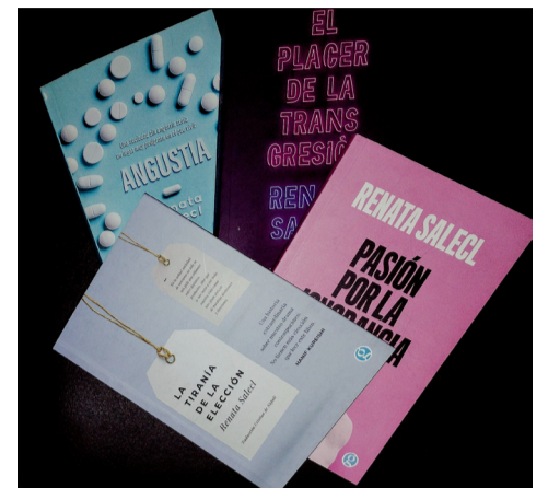
Vse 4 knjige izdane v Argentini

RS: Zelo travmatična situacija je pri vas. Izjemna inflacija, neki defetizem, melanholija v zraku. Sploh ne vem, kako ljudje preživijo, saj so cene zelo visoke. Ampak ko gledam naokoli, vidim polne kavarnice in restavracije. Je pa neverjetno, da kljub krizi obstaja takšna ljubezen do knjig. Sejem založnikov je bil poln ljudi, skoraj 20.000 jih je prišlo.