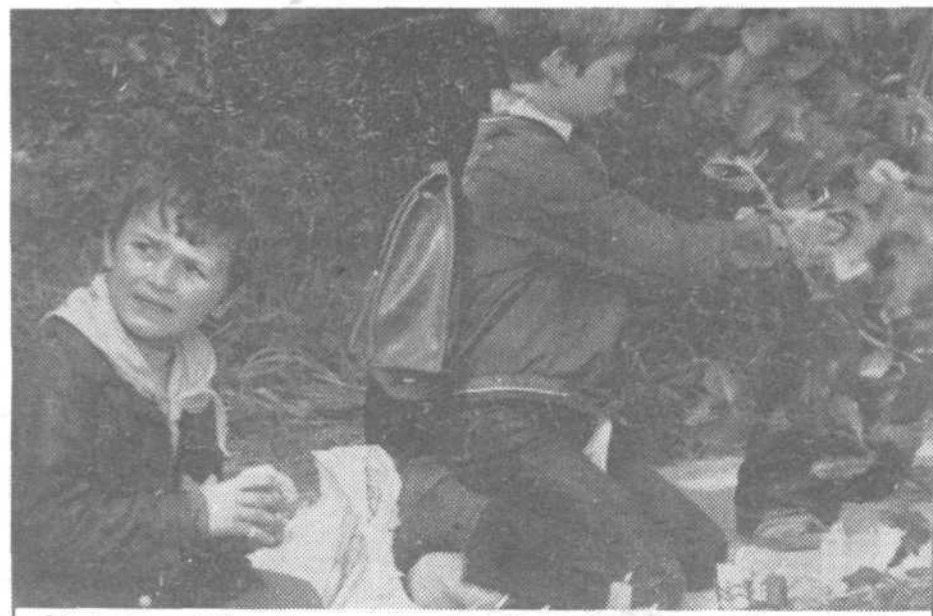
Ob dnevu mrtvih se bomo poklonili tudi spominu žrtvam naše revolucije