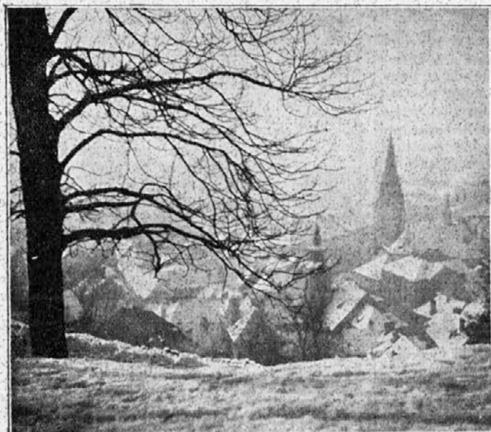
Ljubijana skozi zimsko meglo.

vedno spet mežnarju izmamiti ključ od zvonika. Kadar so zvonili mrliču, vselej, kadar so zvonili prazniku, je bil zraven. Koliko prepovedi je prekršil, koliko opominov preslišal, koliko kazni si nakopal, pa Matevž je ostal zrasel z zvonikom in zvonico. Bil je pač na najkrajši poti, da postane fant z zdvijanim srcem zastran svoje nebrzdane strastnosti. (Dalje prihodnjč.)