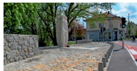
Spomenik z okolico po obnovi aprila 2015