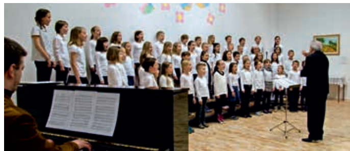
OPZ OŠ Tabor