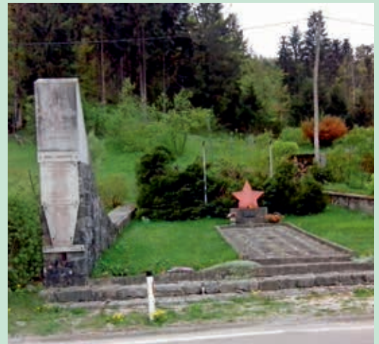
Grčarevec – Grobišče hercegovskih partizanov, EŠD: 21520, Pred obnovo