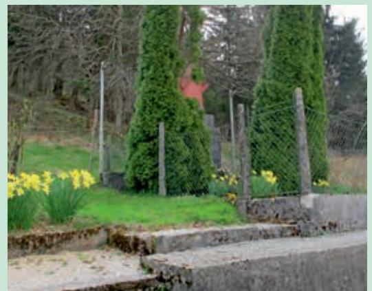
Kalce pri Logatcu – Grobišče hercegovskih partizanov, EŠD: 21526, Pred obnovo