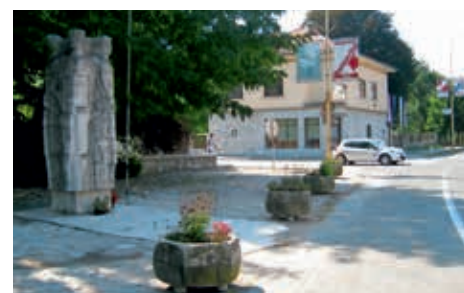
Spomenik z okolico pred obnovo 2012