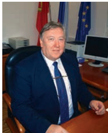
Spoštovane občanke, spoštovani občani,

zdi se, da čas vse hitreje beži. Komaj smo se poslovili od zimskega mraza in vetra, že smo v maju, v mesecu, ki ga krasijo cvetoči vrtovi in travniki. Cvetijo pa tudi že šmarnice, ki prav v maju na poseben in simbolen način obeležujejo krščanski običaj čaščenja Marije, Jezusove matere. Maj je tudi mesec praznovanj in obeleževanj številnih obletnic. Takoj na začetku meseca praznujemo praznik dela, sledi 70. obletnica konca 2. svetovne vojne v Evropi in 100. obletnica soške fronte.