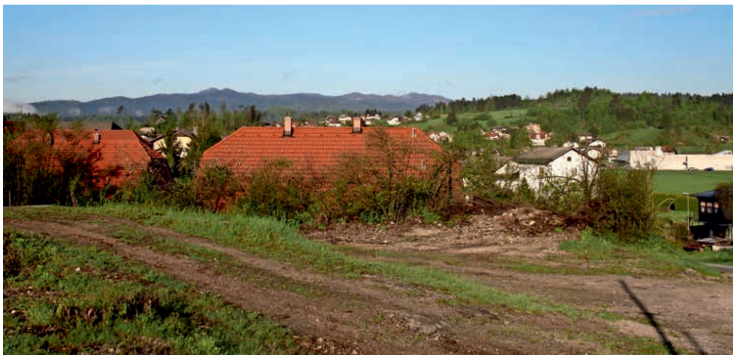
S stare ceste pri železnici nad Mandrgami: Prihod zgodovinskih ljudstev na Logaško iz smeri vzhodne Evrope in Azije (preko Ljubljane) proti zahodu (Padska nižina, Furlanska nižina, Italija). V ozadju pogorje Alpes Iuliae (današnja Hrušica).

Po Teodozijevi smrti l. 395 se rimska država ni nikoli več združila. Naše dežele so bile na prepihu raznih ljudstev in njihovih plenjenj. Že l. 378 so pustošili Goti in Alani, 401. še Vzhodni Goti, Vandali in Svebi. V 5. stoletju so bili glavna nevarnost Huni. Povzročili so veliko selitev narodov. Limes – sistem utrdb oziroma zapora Claustra Alpium Iuliarum (z njim tudi Ad Pirum – Hrušica, Lanišče in Martinj Hrib (Brst)) je verjetno propadel, ko so se vzhodni Goti na čelu s kraljem Teodorikom odzvali pozivu vzhodnorimskega cesarja Zenona in leta 490 v bitki ob Soči premagali vojsko kralja Odoakra, ki je kot poveljnik enega od germanskih plemen pred tem leta 476 strmoglavil zadnjega zahodnorimskega cesarja Romula Avgusta. Pomemben element v premikih tedanjih ljudstev je bila tudi pojava močnih