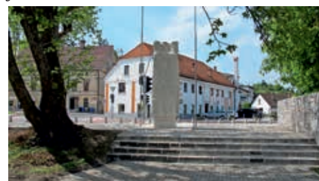
Po več desetletjih končno urejeno stopnišče na hrbtni strani območja spomenika, foto Renata Gutnik