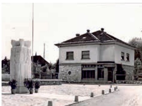
Spomenik z okolico kmalu po postavitvi 1958