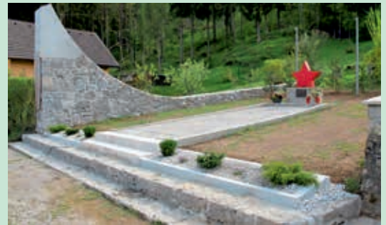
Po obnovi