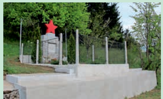
Po obnovi