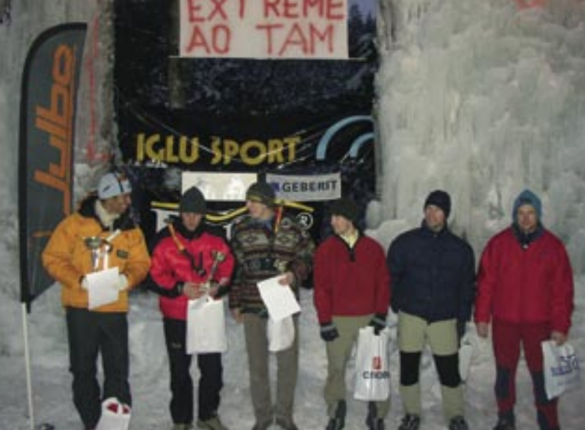
Podelitev priznanj najboljšim na tekmi Dolfa Extreme 2005 na Smolniku pri Rušah