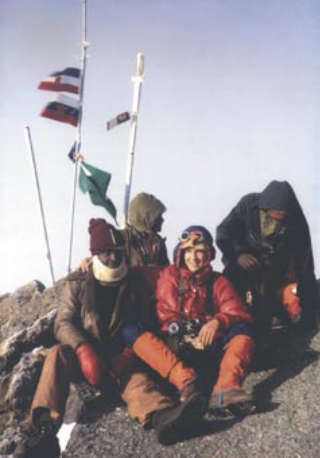
Odprava Kilimandžaro '82