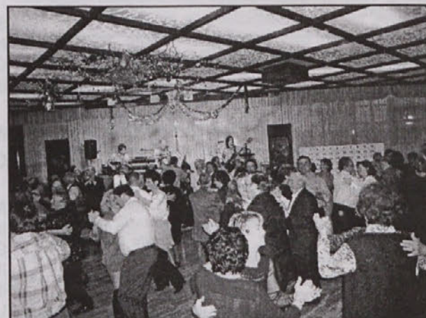
17 dicembre, Hotel Riviera: Serata conviviale organizzata dalla CAN con la partecipazione di quasi duecento connazionali e simpatizzanti.