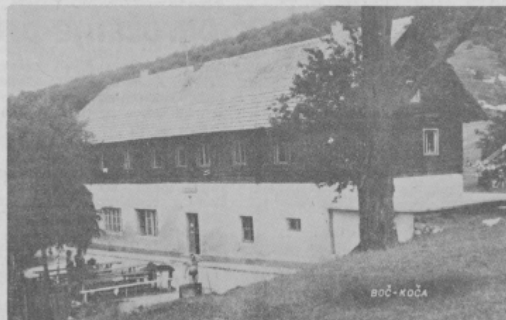
Planinski dom na Boču pred obnovo. Takšen bi postal ozko grlo za hitrejši razvoj turizma v tem delu Slovenije.

Naslednji tečaj za nove voznike v AMK Markovci bo posredoval tečajnikom vse potrebno znanje in izkušnje, da bodo prispevali k varni vožnji in preventivi v cestnem prometu svoj delež. Naj ne bo na naših cestah prometnih nesreč in materialne škode.