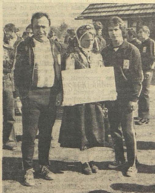
Spomin na brhko Gorenjko

Uvodoma sem že omenil, da smo lahko še posebno veseli obnašanja naših predstavnikov. Ni prvič, da so športnice in športniki steklarne prejeli dragoceno trofejo — pokal za fair play, ki se vsako leto podeljuje najbolj športni in disciplinirani ekipi. Letos je bilo za to odličje več kandidatov. Vendar je komisija, ki so jo sestavljali predstavniki vseh petih podjetij — udeleženk iger, menila, da gre naši ekipi kot najbolj disciplinirani in čigar vodstvo je največ prispevalo k uspešnemu razvoju vseh prejšnjih kot tudi tokratnem peteroboju, še posebno priznanje. Prav tako je komisija imela v vidu dejstvo, da so predstavniki Steklarne, tako tekmovalci kot vodstvo, največ prispevali k medsebojnemu zblizanju in razvijanju prijateljskih odnosov. Še posebno pa je bilo poudarjeno, da je ekipa Steklarne edina doslej, ki je to trofejo osvojila tretjič zapored. Zato koristim priložnost, da se kot vodja vseh ekip še enkrat zahvalim vsem sodelujočim, našim predstavnikom na Peteroboju '76 v Kranju.