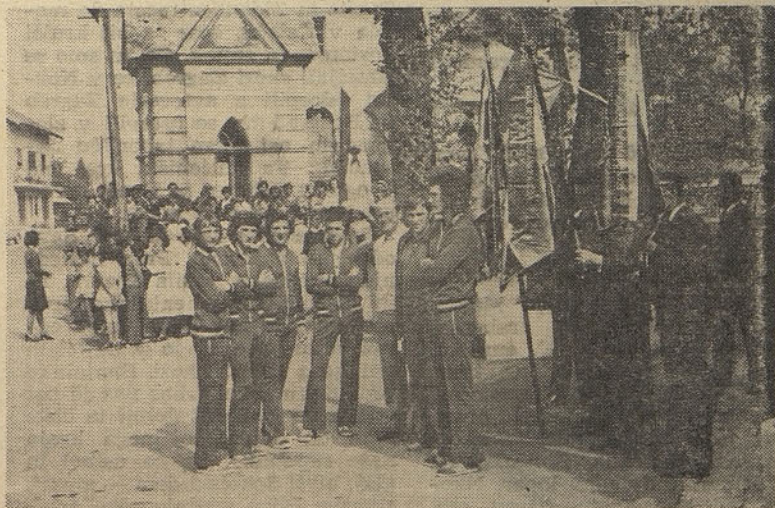
Člani Brodarskega društva Hrastnik pred prihodom štafete

jo sprejeli že naslednji nosilci in štafeta palica je krenila na svojo pot naprej do Beograda z najboljšimi in pristréniimi čestitkami vseh nas ljubljene maršalu Titu za njegov rojstni dan.