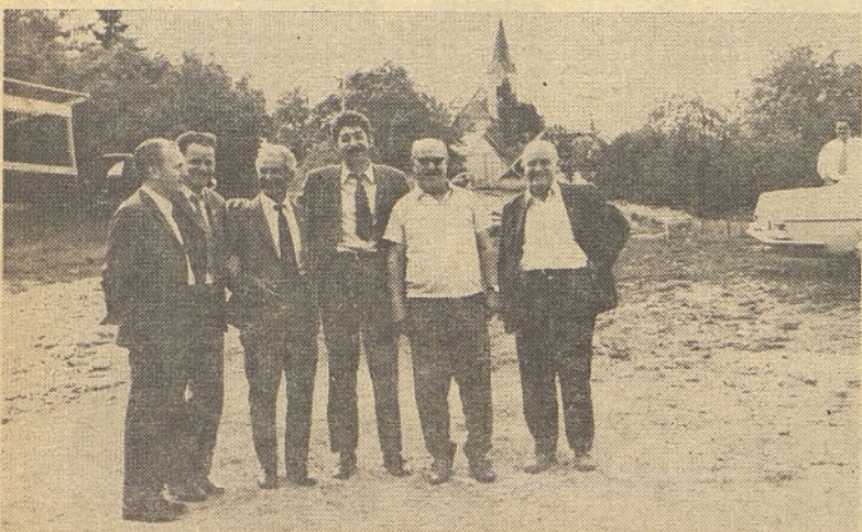
Clani delegacije so ob priložnosti obiska obiskali tudi planinsko postojanko v Gorah