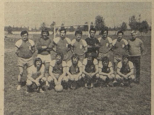
Nogometaši kljub dobri igri slabši kot preteklo leto