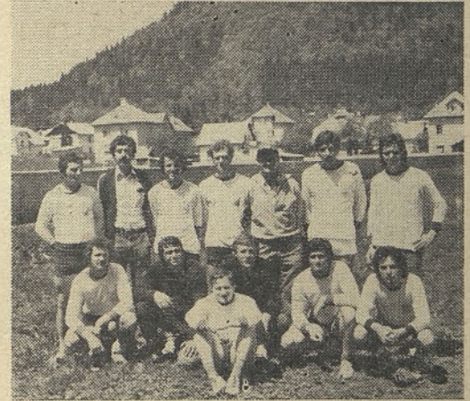
Ekipo rokometišev, udeležencev »Peteroboj '76«