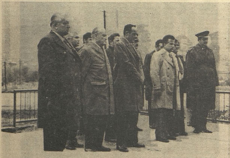
Clani hrastniške delegacije, ki je z vlakom »Bratstva in enotnosti 74« obiskala občino Raška (polaganje venca pred spomenikom žrtev fašizma)

Takrat smo šele spoznali, kako blizu smo si. V nevezanem pogovoru smo si izmenjali vse, kar človeka — prijatelja zanima. Prepričan sem, da takšnega gostoljubja ne moremo biti deležni nikjer drugje. Zato se bomo omenjenega srečanja še posebno radi spominjali. Kaj pomeni imeti prijatelja in kaj pravzaprav prijatelj je, so nam naši gostitelji to-