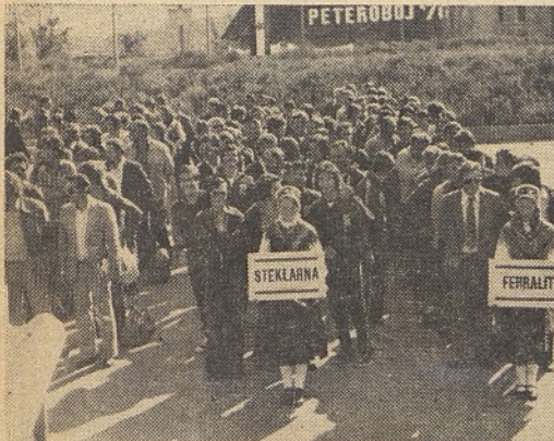
Predstavniki Steklarne med slavnostno otvoritvijo

Drugače pa je to v večjih mestih, kjer se vse skupaj izgubi v množici vsakodnevnega življenja. In prav zaradi tega je imel organizator precej težav predvsem pri nabavi in rezervaciji tekmovalnih prizorišč. Zato gledano s tega stališča smo prepričani, da so pri-