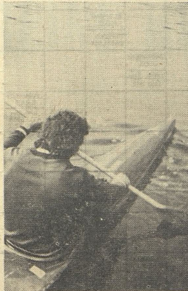
Tov. Barič s štafeto palico v čolnu vesla proti nasprotnemu bregu

Izredno lepo je bilo videti preko trideset čolnov, ki so nato skupno spremljali štafeto palico do nasprotnega brega, tam so