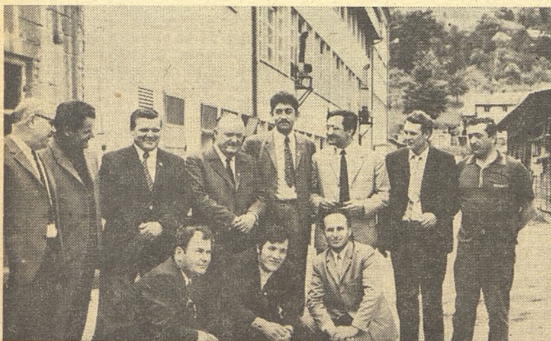
Clani uradne delegacije občine Raška v Hrastniku