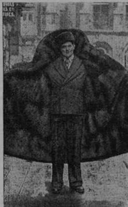
Kožuh za 1000 angleških funtov šterlingov. V predvojnem času je bil na račun ruskega velikega kneza izdelan kožuh za ogromno svoto 1000 funtov šterlingov. Kožuh ni bil nikoli rabljen in je v Londonu od sedajnjega lastnika na prodaj za 300 funtov šterlingov.