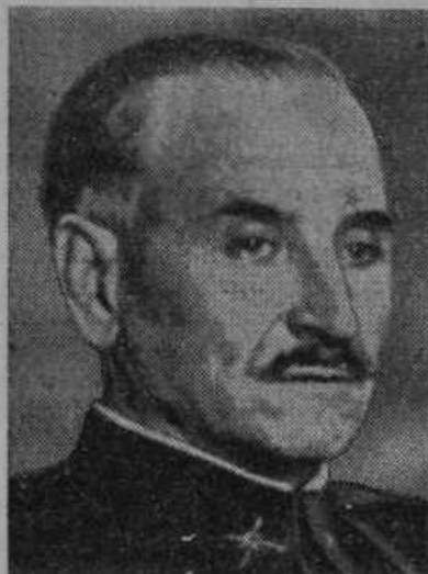
Španski general Llano, ki prodira po zavzetju Malage z južno nacionalno armado proti pristanišču Almeria.