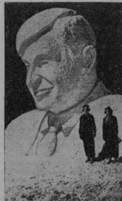
V Hilbingu, Minnesota (Združene države Sev. Amerike) so postavili spomenik filmskemu igralcu W. Rogersu, ki je smrtno ponesrečil pri letalski nesreči v Alaski pred poldrugim letom. Ogromna glava je iz leda. Če obsijejo glavo na večer žarometi, zgleda kakor bi bila iz belega marmorja.