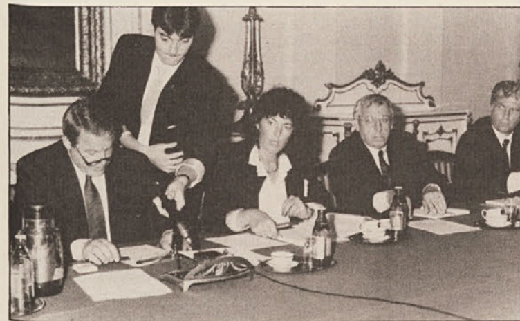
Na seji Sosveta je bil kancler Franc Vranitzky prisoten, zdaj ga želi Sosvet povabiti ponovno.