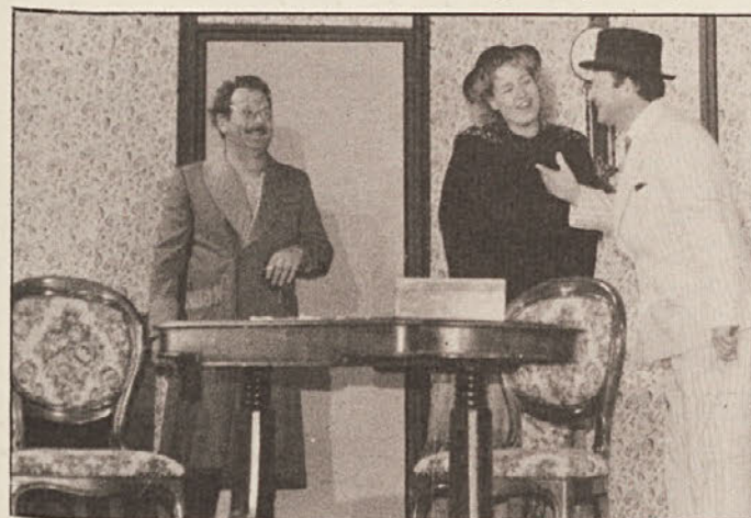
Prizor iz komedije „Gospod Evstahij z Goriške“ dramskega odseka prosvetnega društva „Štandrež“.

Skupina je prejela številna priznanja, med njimi tudi zlato Linhartovo listino, ki jo podeljuje Zveza kulturnih organizacij Slovenije.