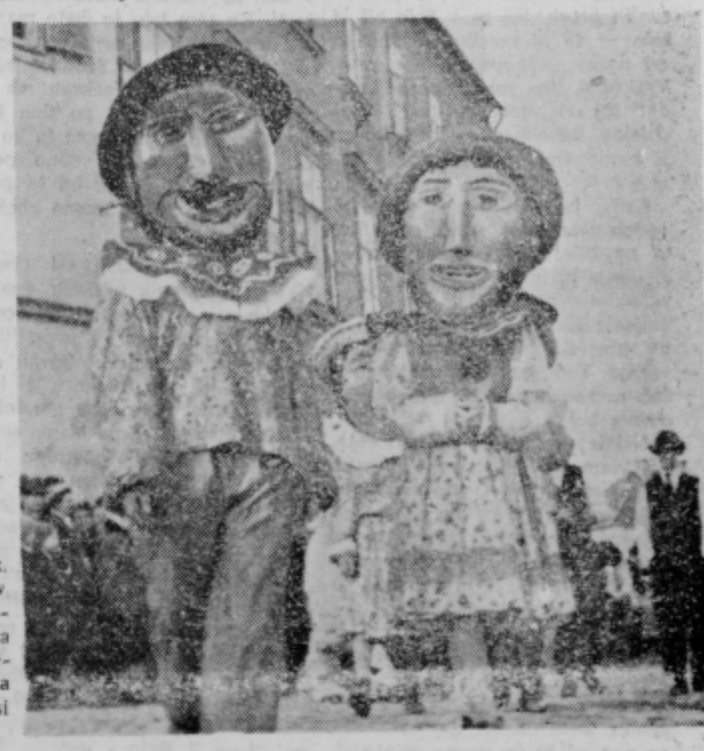
Odrasli se domislijo raznih mask. Nekateri se lotijo diplomatov, drugi vojščakov in ezaznih osebnosti iz preteklosti. Ti maski sta bili lani zanimivi zaradi odvoličnosti. Spredaj in zadaj obraz. Ka rikaturna značaja, ki se mu vsi vedno posmehujejo.