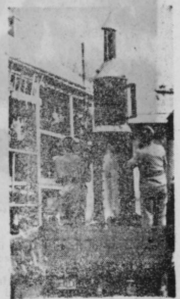
Gagarin, Titov, Glenn so svetovno znani astronauti. Ni čudno, če so ljudje ob pritu svetovne zanimivosti po svoje ponazarjali. Lepo bi bilo, če bi tudi ptujski raketni strokovnjaki uspeli s svojimi poizkusi — polet na Hajdino..