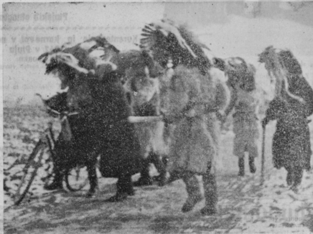
Kurent je res prerastel po svojem videzu samega sebe. Vsak rad da roko, Nova pomlad prihaja, prijateljstvo naj združuje ljudi pri delu in pri vsakdanjem življenju. V slogi je moč. Kurenti so ostali, ker so rodovi cenili njihov velik pomen.