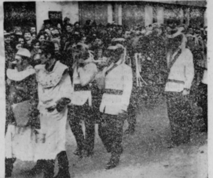
Hajdinci na posebno svečan način pokopajo pusta. Ta običaj ponavlja vsako leto njihova skupina, ki se ob prireditvah v Ptuj dobco postavi.