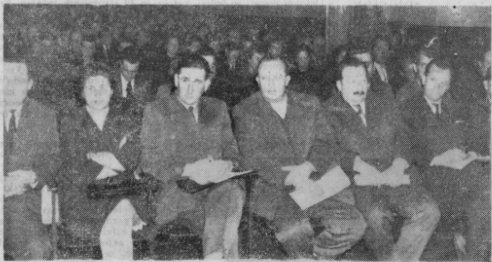
Prdstavnikji ljudske oblasti, JLA in množičnih organizacij na konferenci.