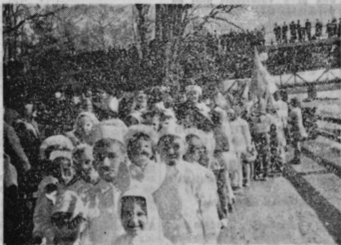
Starsi pripravljajo otrokom pustno veselje. Mladi rod bo nadaljeval pustno razpoloženje, ki so ga ohranili iz davnine odrasli. Šole pomagajo, da bi imeli otroci čim več razvedrila ob pustu.