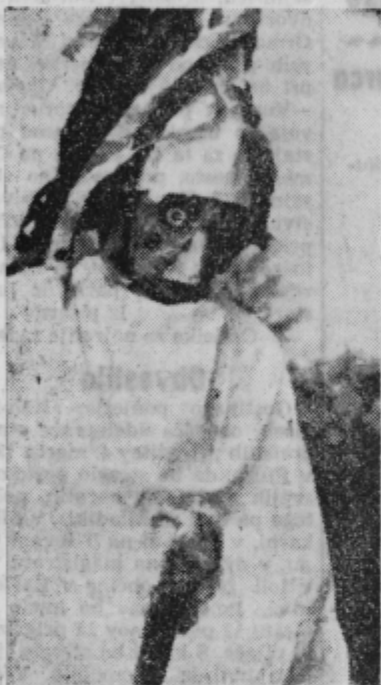
Kot zapustijo piščanci kokljo, tako smejo ob pustu po vaseh niže Ptuja otroci z doma, našemljeni v piceke, ki želijo gospodinjam srečo pri perutnini, da bi kokoši celo leto nesle in koklje dobro valile. Lepše so piceki maskirani, bolj zgovorni, boljši komedijantje, raje jih gospodinje nagradijo z jajci.