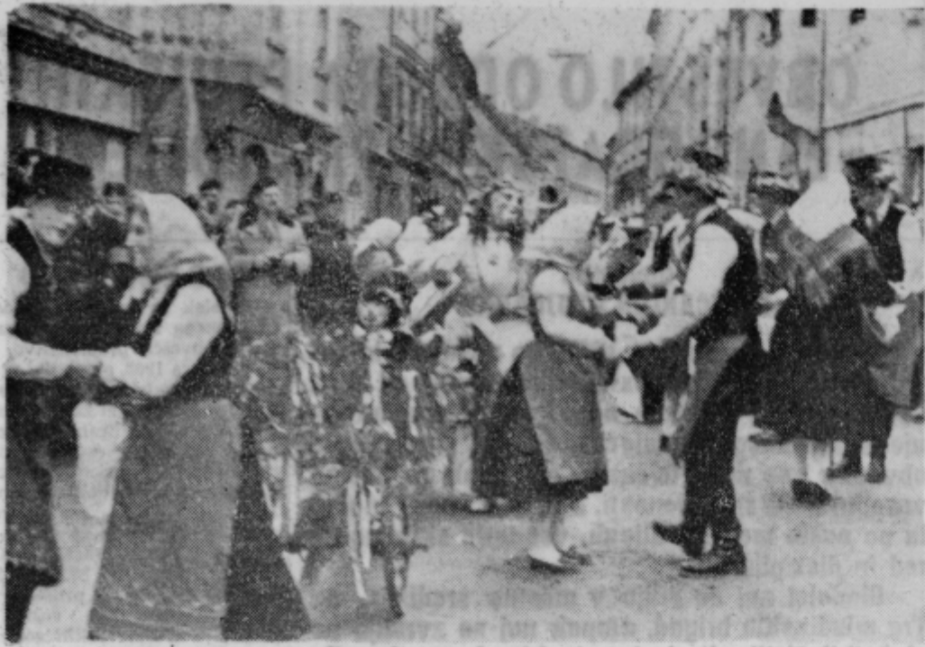
Ko ni poroke in pevskih svatov v Cirkovcih, si vaščani pripravijo pustno gostijo. Otupljeno smreko ali bor položijo na pluznico, nanj posadijo »zenina« in svatje gredo po vasi.