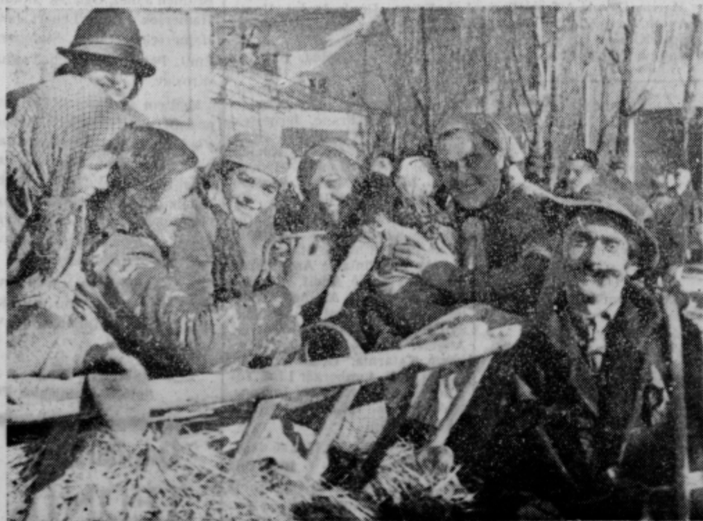
Cigani iz Dornave so bili zelo posrečni. Sicer resni in prizadevni kmetje tudi radi za pust spremeni-jo svojo zunanost in odidejo po vaseh ugotavljat, kako so ljudje vljudni napram gostom, ki se še niso pomirili s stalnim bivališčem delom in urejenim življenjem. Lani so dobili lepo nagrado in v Zadržnem domu v Dornavi so se potem prav lepo zabavali.